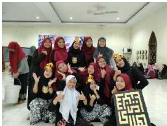
Kegiatan PPMAB Peduli Bencana