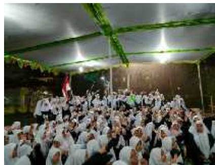
Kegiatan Hari Santri