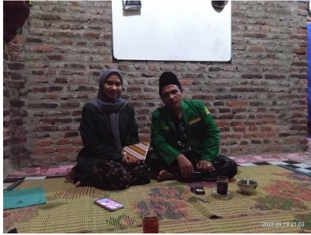
Wawancara bersama pembina IPNU ranting Juragan