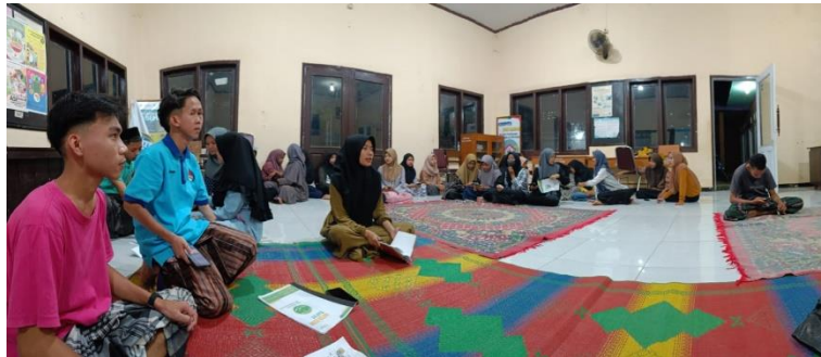
Observasi kegiatan diskusi perencanaan kegiatan