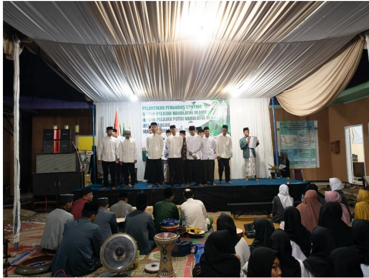
observasi kegiatan pelantikan IPNU- IPPNU ranting Juragan