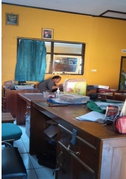
RUANG GURU SMK MUHAMMADIYAH BLIGO PEKALONGAN