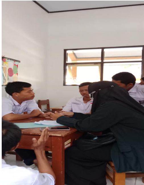
PENELITI WAWANCARA DENGAN 5 SISWA TUNAGRAHITA KELAS VIII