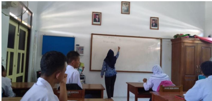
KEGIATAN PEMBELAJARAN SISWA TUNAGRAHITA KELAS VIII DI SLB WIRADESA KABUPATEN PEKALONGAN