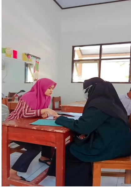
PENELITI WAWANCARA DENGAN GURU PAI DI SLB WIRADESA KABUPATEN PEKALONGAN