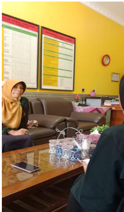
PENELITI WAWANCARA DENGAN WAKA KURIKULUM SLB WIRADESA KABUPATEN PEKALONGAN