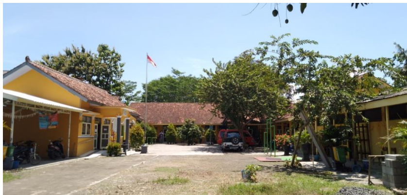
SLB WIRADESA KABUPATEN PEKALONGAN