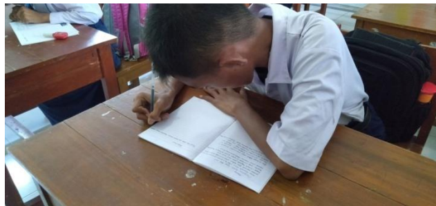
KEGIATAN MENYALIN TULISAN DI PAPAN TULIS BAGI SISWA TUNAGRAHITA KELAS VIII