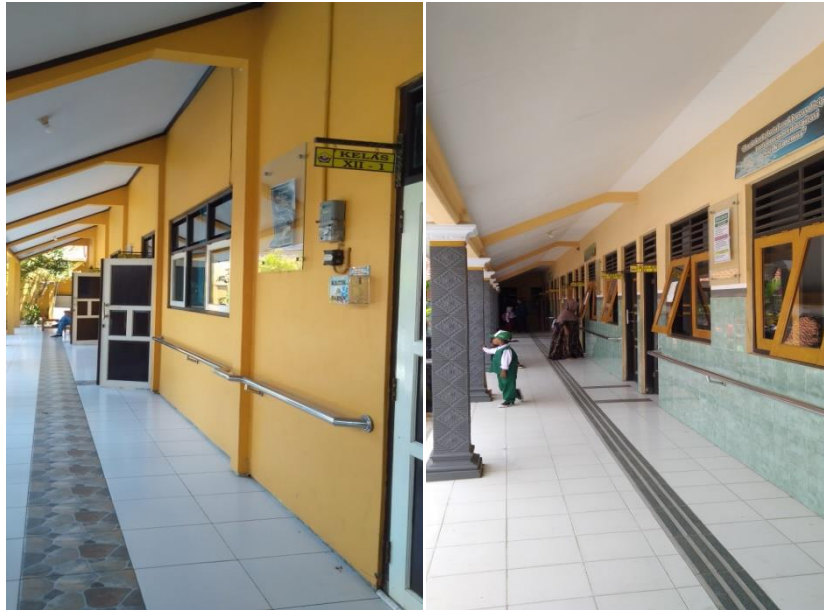
KEADAAN KELAS DI SLB WIRADESA KABUPATEN PEKALONGAN