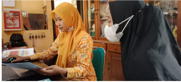
PENELITI WAWANCARA DENGAN GURU TU SLB WIRADESA KABUPATEN PEKALONGAN