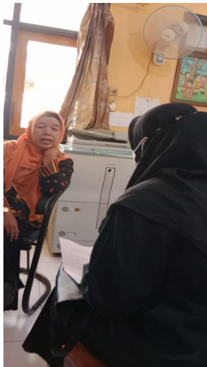
PENELITI WAWANCARA DENGAN KEPALA SLB WIRADESA KABUPATEN PEKALONGAN