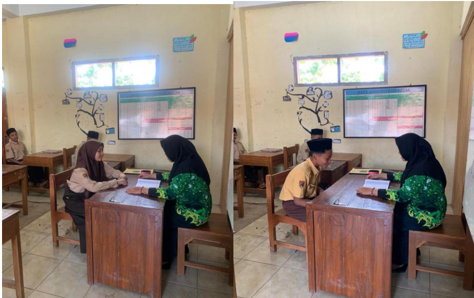
Pemberian Perlakuan Metode Tutor Sebaya