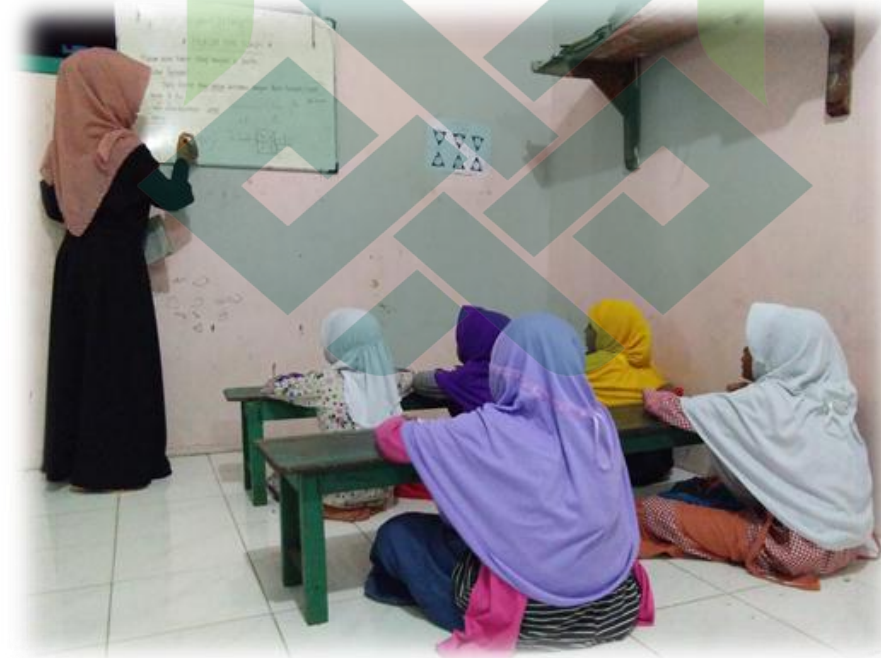
Proses pembelajaran metode qiro'ati jilid I