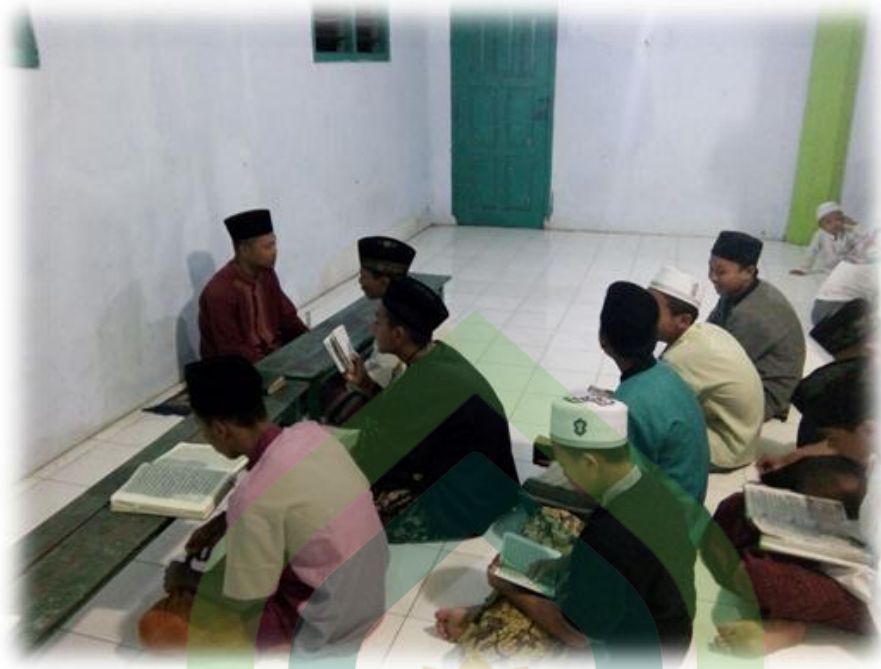
Pembelajaran metode qiro'ati jilid VI