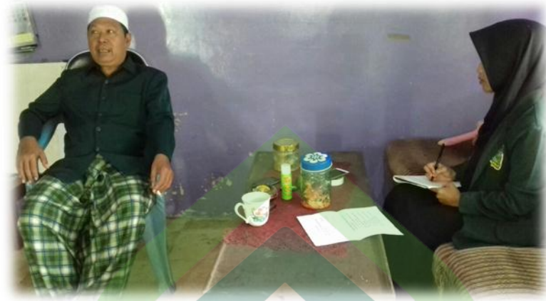
Wawancara dengan Kepala TPQ