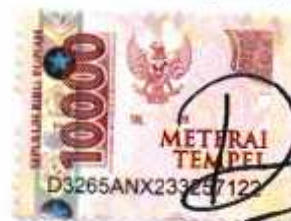
DEWI LIMRO ATI SOLIKHA NIM. 30522065