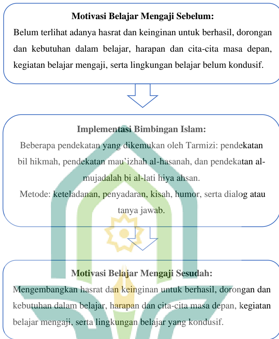
Bagan 1.1 Kerangka Berpikir