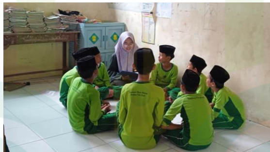
Dokumentasi Wawancara Kepada Siswa Kelas VI MI Salafiyah Wuled