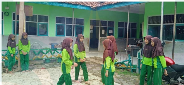
Dokumentasi Pemanasan Berbasis Permainan Gobak Sodor