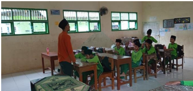
Dokumentasi Kegiatan Pendahuluan