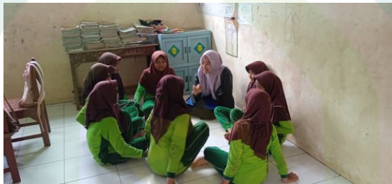
Dokumentasi Wawancara Kepada Siswi Kelas VI MI Salafiyah Wuled