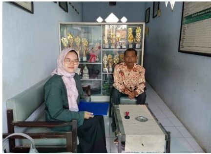
Dokumentasi Wawancara dengan Kepala Sekolah Sekaligus Guru