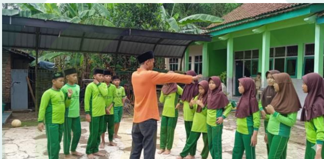
Dokumentasi Guru Memberikan Contoh Gerakan Pemanasan