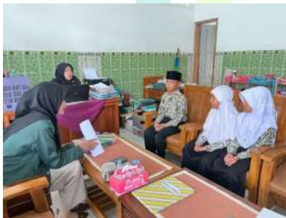
Gambar 3 Wawancara dengan Peserta didik