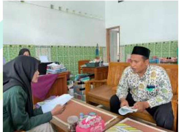
Gambar 2 Wawancara dengan Guru Pembimbing TIK