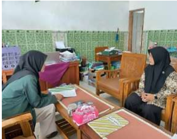
Gambar 1 Wawancara dengan Kepala Sekolah