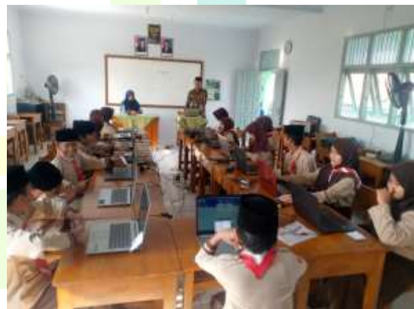
Gambar 4 Kegiatan Ekstrakurikuler TIK