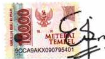
Ernis Oktaviola NIM.2118055