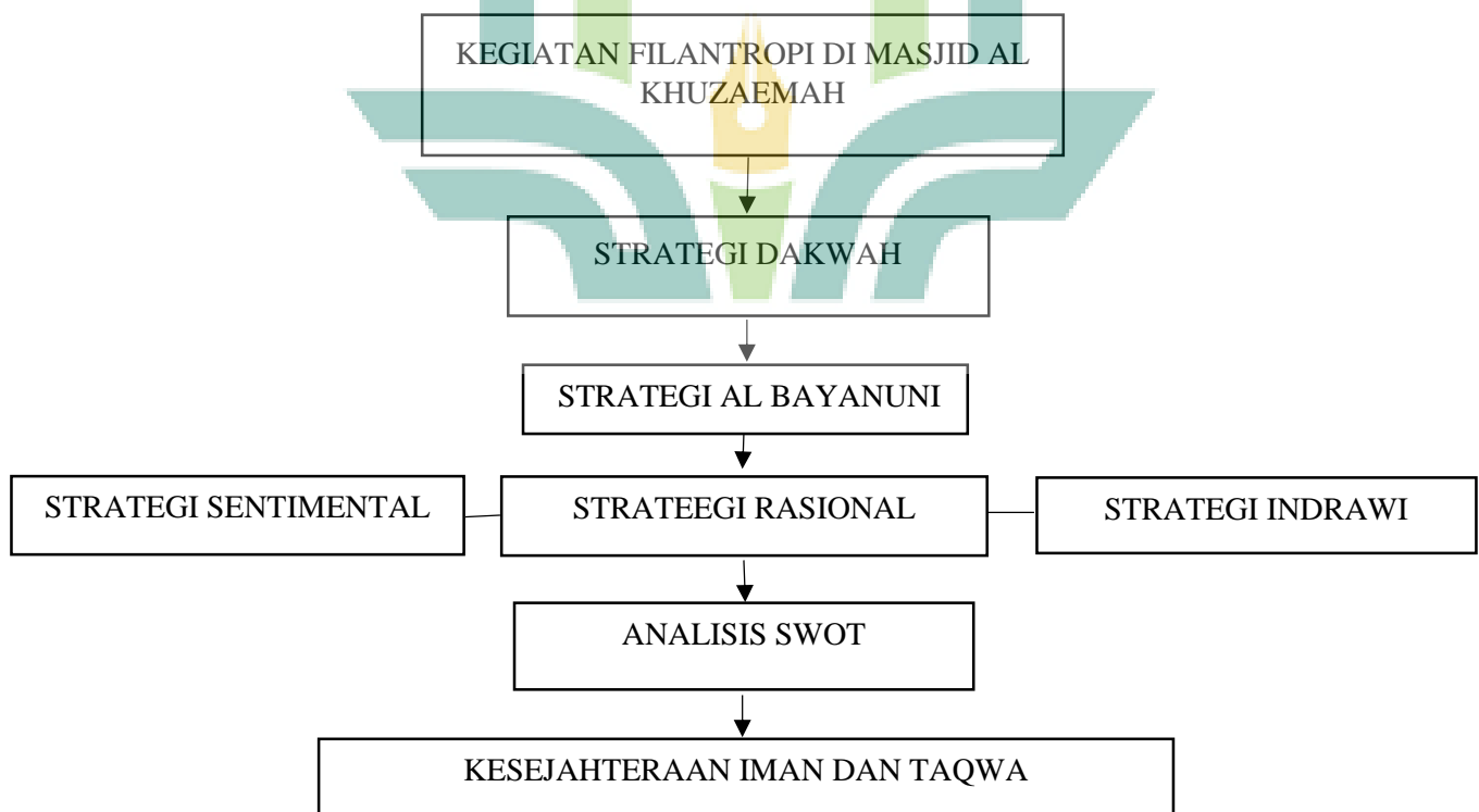
Bagan 1.1 Kerangka Berpikir

Dengan demikian, kerangka konseptual penelitian ini menegaskan bahwa penerapan strategi dakwah berbasis filantropi Islam merupakan upaya konkret dalam mewujudkan dakwah yang aplikatif dan berdampak luas. Melalui pendekatan ini, Masjid Al Khuzaemah tidak hanya menjadi tempat ibadah, tetapi juga menjadi agen transformasi sosial yang mampu menebarkan nilai-nilai Islam secara menyeluruh dan berkesinambungan.