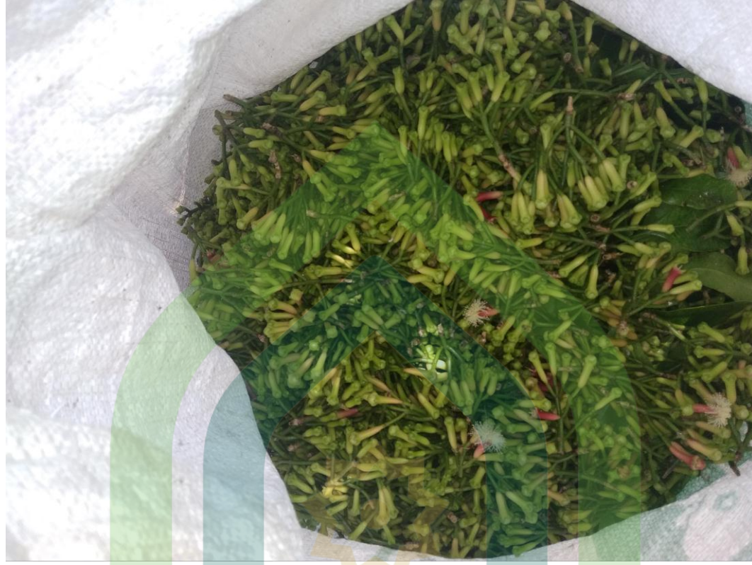
Hasil panen cengkeh