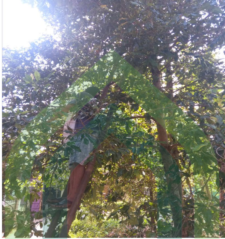
Prosesi panen cengkeh