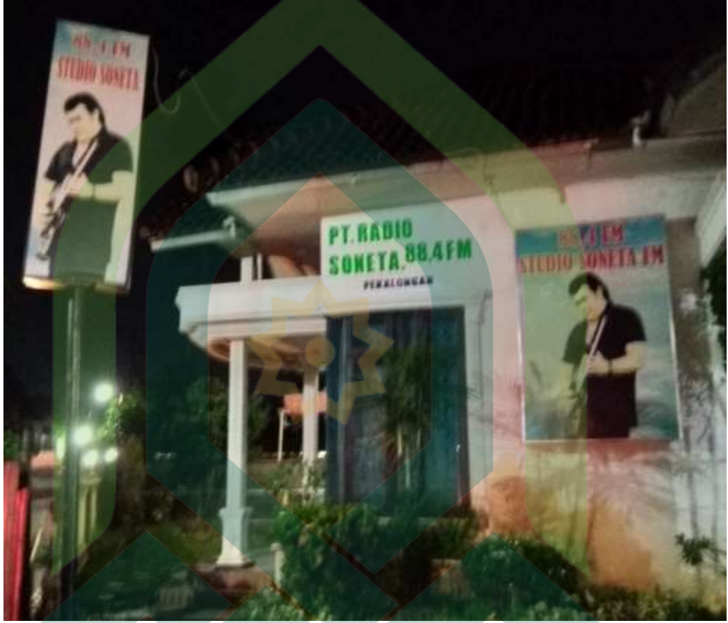
C. Gedung radio Soneta 88.4 FM Desa Simbang Wetan 1 No. 2 Kecamatan Buaran Kabupaten Pekalongan.