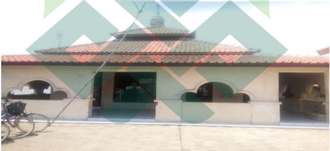
Mushola SMP Negeri 1 Wonokerto