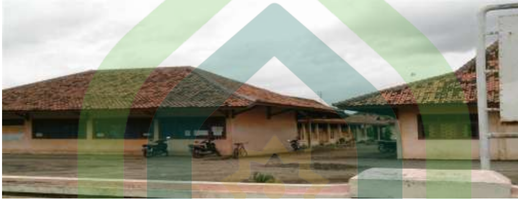
Gambar depan SMP Negeri 1 Wonokerto