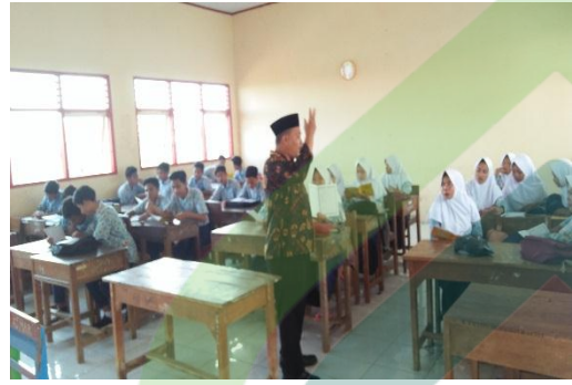
Guru Pendidikan Agama Islam pada saat menggunakan metode demonstrasi