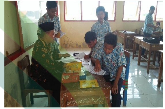
Guru Pendidikan Agama Islam pada saat menggunakan metode sorogan