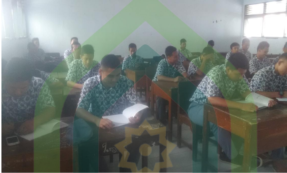
Foto 1: Peserta Didik kelas X TKR 1 mengisi Kuesioner penelitian.