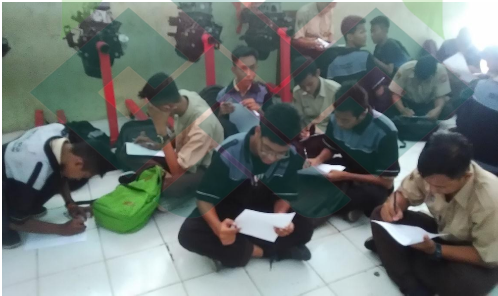
Foto 2: Peserta Didik kelas X TKR 2 mengisi Kuesioner penelitian.