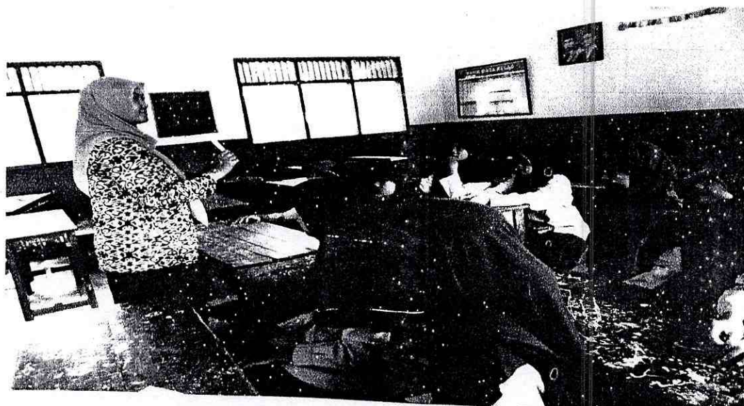
Dokumentasi saat kegiatan observasi pembelajaran Qur'an Hadits di MI Salafiyah Pucung Kecamatan Tirto Kabupaten Pekalongan