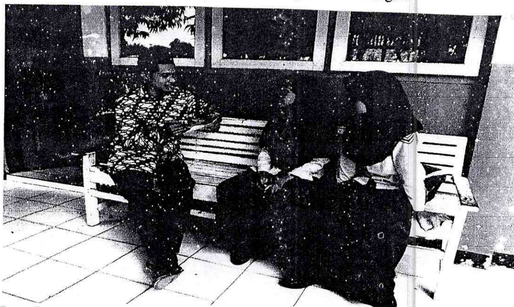
Dokumentasi kegiatan wawancara terhadap siswa mengenai pengalaman setelah KBM Mapel PAI di MI Salafiyah Pucung Kecamatan Tirto Kabupaten Pekalongan