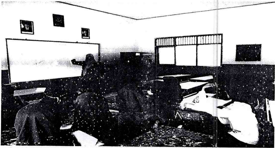
Dokumentasi saat kegiatan observasi pembelajaran Qur'an Hadits di MI Salafiyah Pucung Kecamatan Tirto Kabupaten Pekalongan