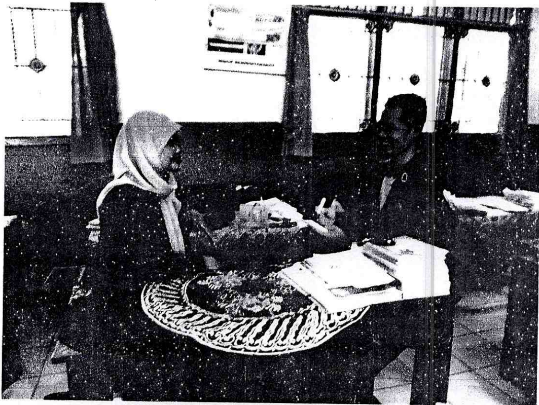
Dokumentasi kegiatan wawancara penulis terhadap guru PAI di MI Salafiyah Pucung Kecamatan Tirto Kabupaten Pekalongan