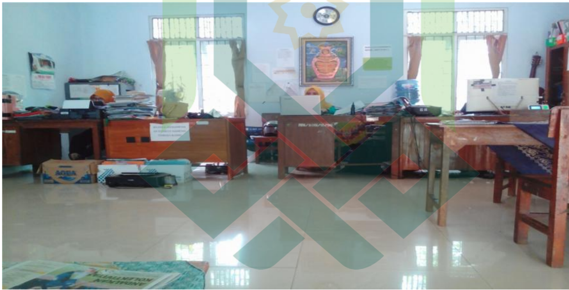
Kondisi Kantor MIN 1 Batang