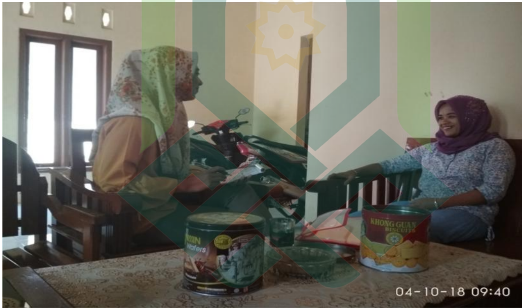
Wawancara Pribadi dengan Ibu Magfiroh selaku orang tua Fityatu Taqwa (siswa MIN 1 Batang kelas IV)