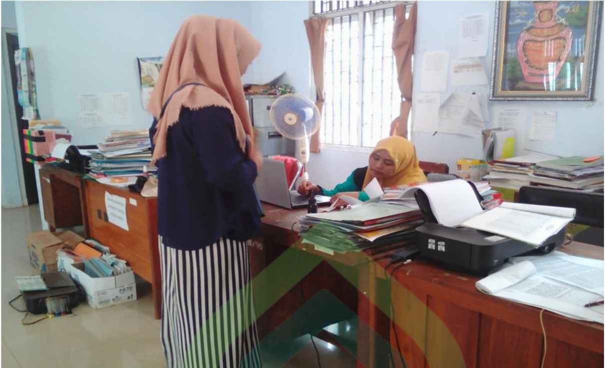
Wawancara Pribadi dengan Kepala Sekolah MIN 1 Batang