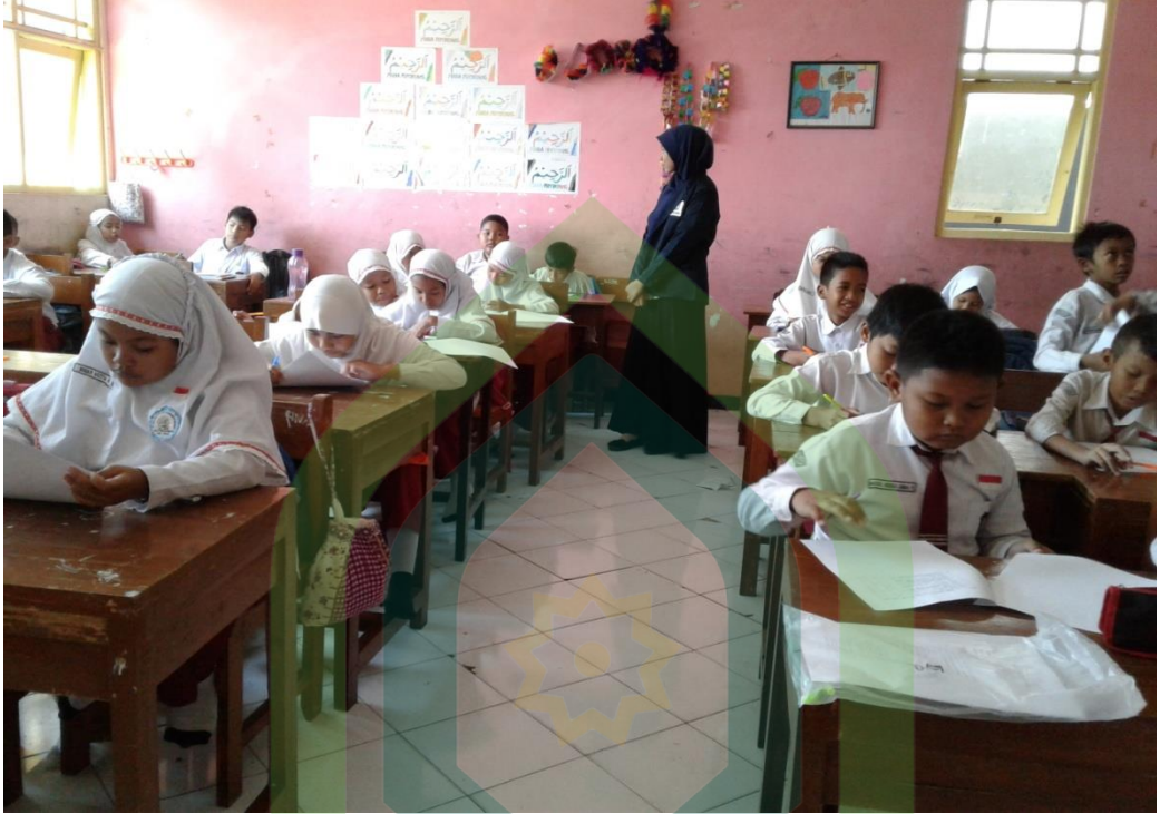
Foto Penyebaran dan Pengisian Uji Coba Angket Penelitian di SD Muhammadiyah 01 Kandang Panjang