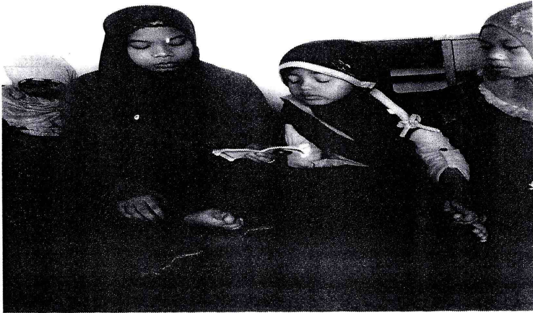
Pembacaan Surat Al-Waqi'ah dan Tahlil