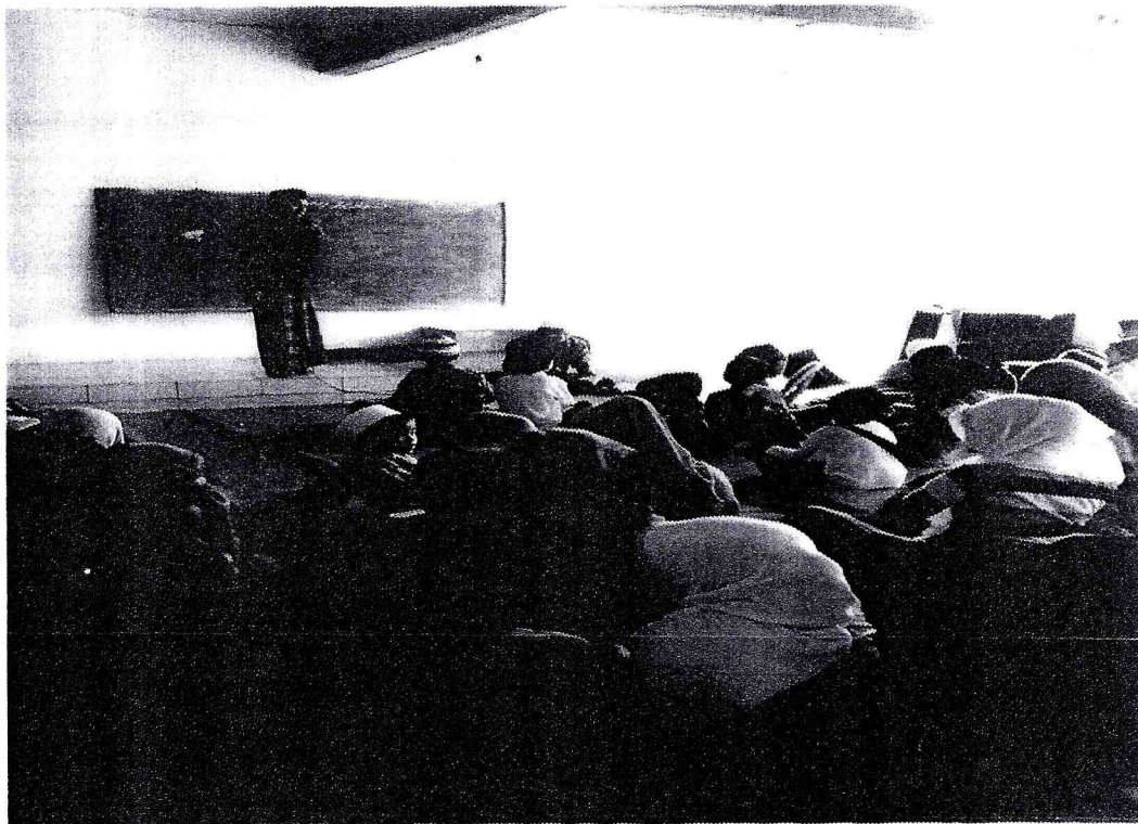
Acara Tausiyah Keagamaan