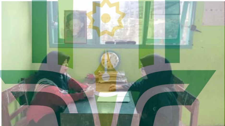
Gambar 6. 3 Sesi wawancara