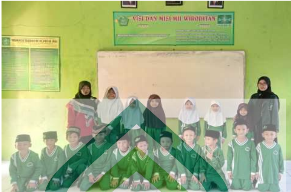
Gambar 6. 4 Sesi foto bersama dengan guru dan siswa kelas 1 MII Wiroditan