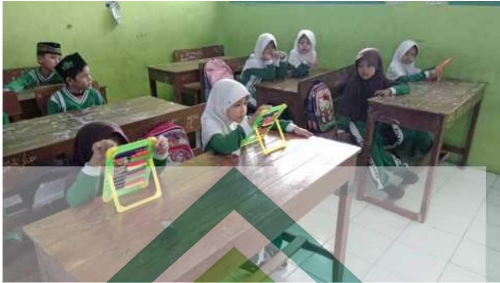
Gambar 6. 2 Pembelajaran dengan menggunakan media sempoa