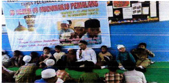
Gambar 5: Para Siswa Menjadikan Guru Sebagai Salah Satu Penerapan Sumber Belajar Akhlak dengan Berjabat Tangan Setiap Berangkat dan Pulang