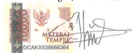
(Nurul Nafi'ah Setiani)