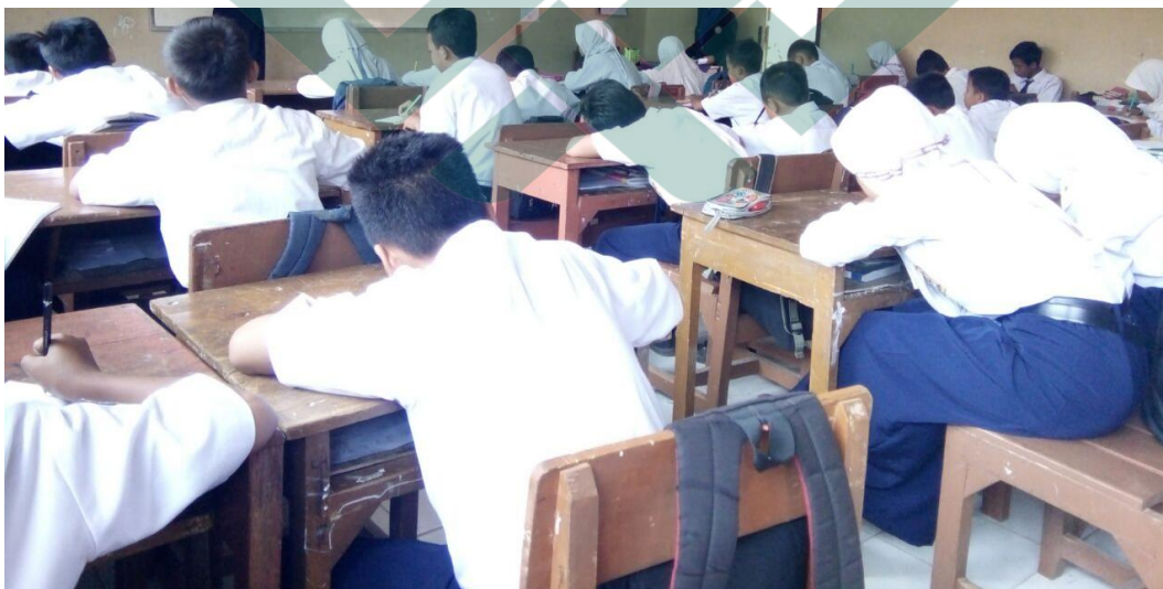
Gambar.2 Pengisian Angket oleh siswa kelas VIII SMP Negeri 2 Wiradesa.