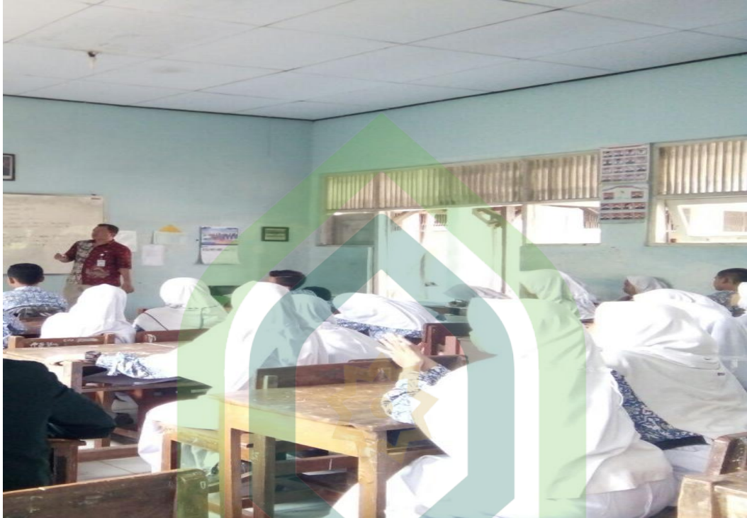
Gambar.1 Observasi kegiatan pembelajaran Pendidikan Agama Islam di SMP Negeri 2 Wiradesa.