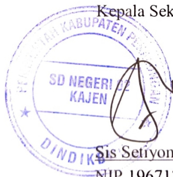
Sis Setiyono, S.Pd.SD