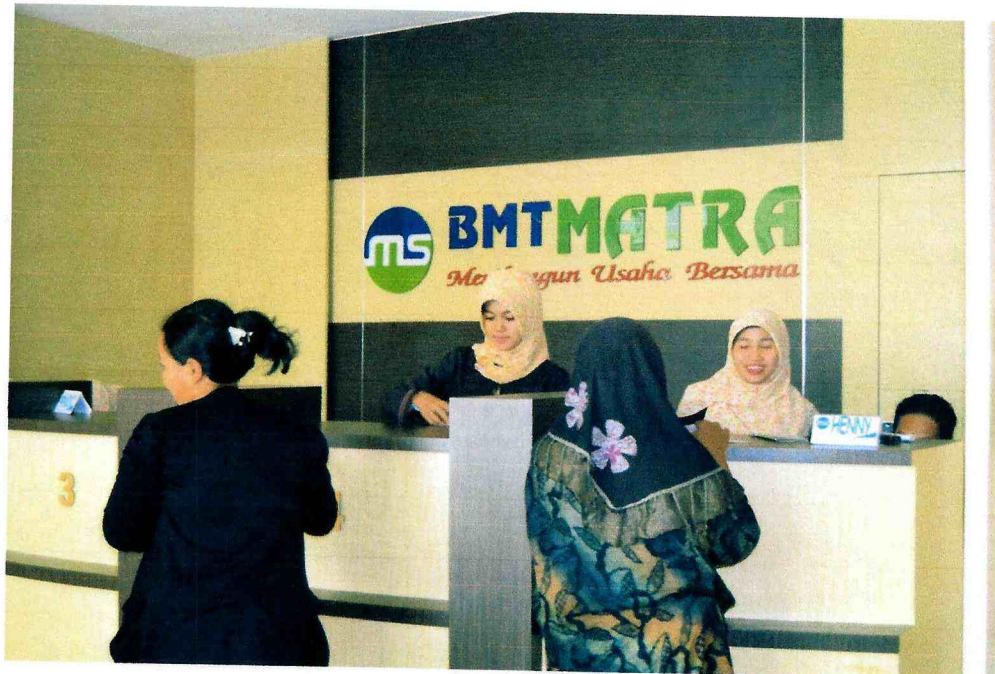
KETERANGAN GAMBAR : TRANSAKSI NASABAH DENGAN TELLER