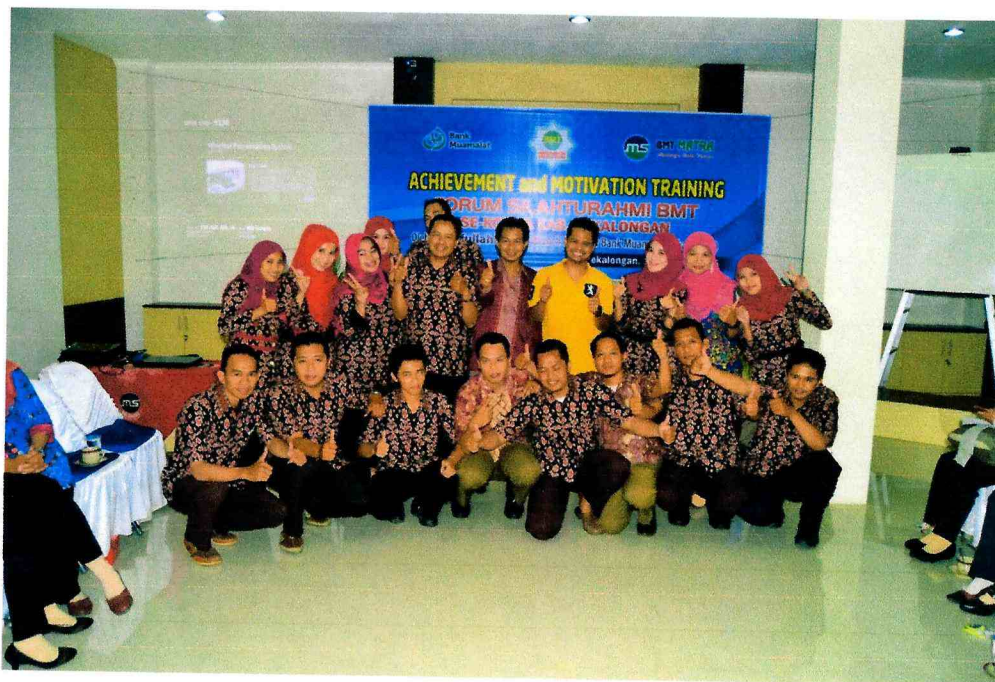
KETERANGAN GAMBAR : PELATIHAN MOTIVASI DI BMT MATRA PEKALONGAN.