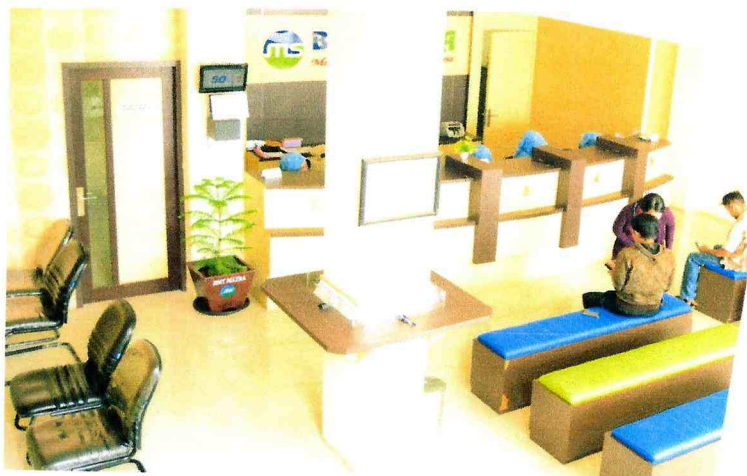
KETERANGAN GAMBAR : RUANG TRANSAKSI BMT MATRA PEKALONGAN