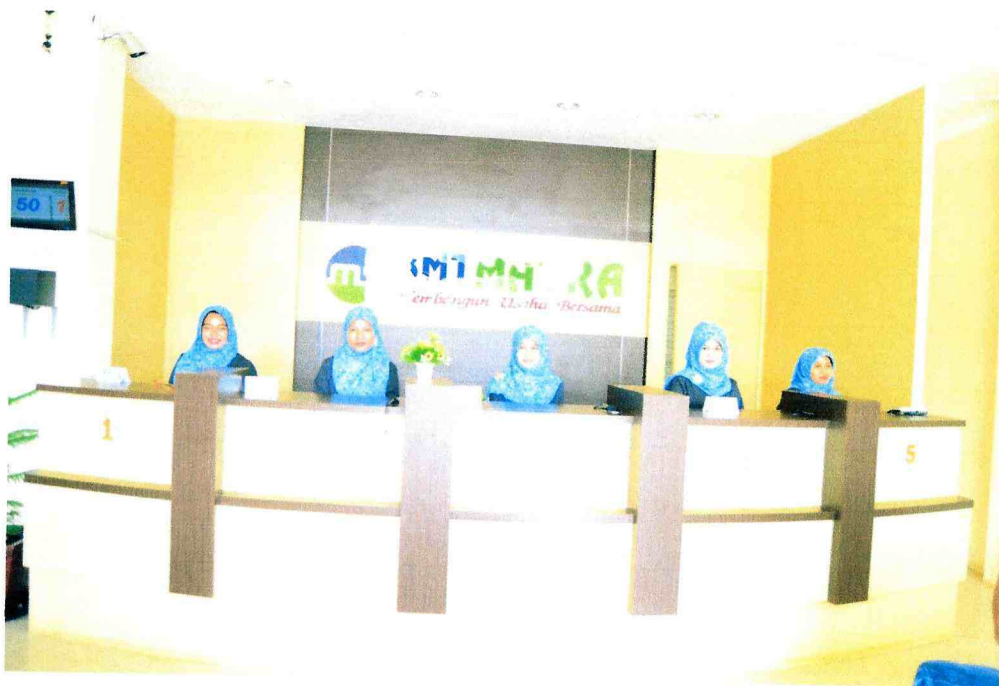
KETERANGAN GAMBAR : TELLER BMT MATRA PEKALONGAN