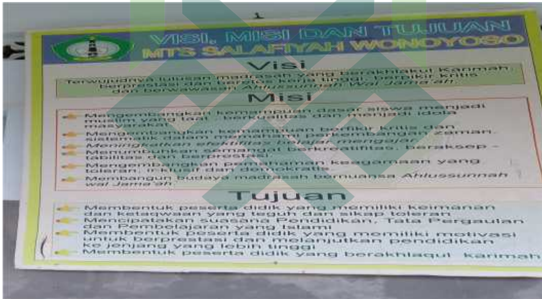
Gb.2: Visi, Misi dan Tujuan MTs Salafiyah Wonoyoso Buaran Pekalongan