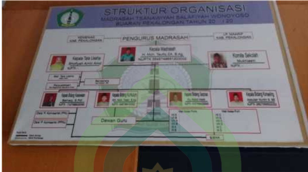
Gb.3: Struktur oeganisasi MTs Salafiyah Wonoyoso Buaran Pekalongan