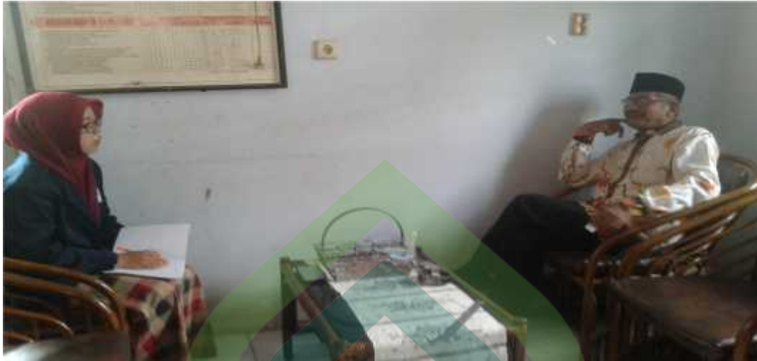
Gb. 1: Proses wawancara dengan kepala sekolah MTs Salafiyah Wonoyoso Buaran Pekalongan