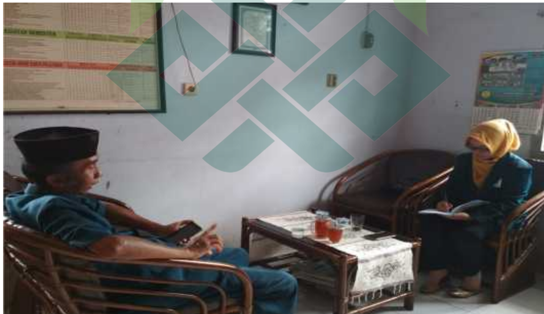
Gb.4: Proses wawancara dengan guru mata pelajaran bahasa Arab MTs Salafiyah Wonoyoso Buaran Pekalongan