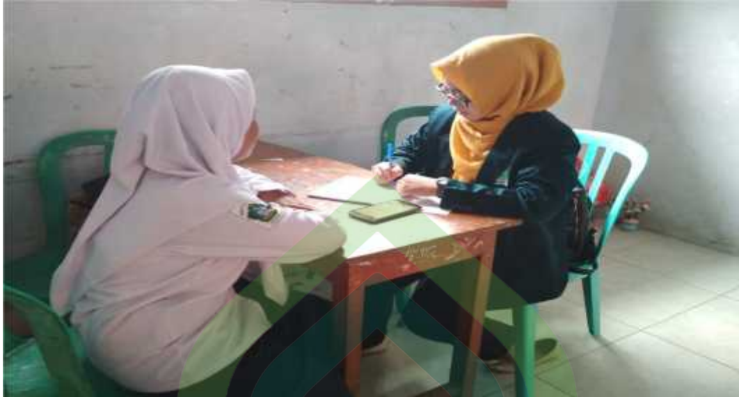
Gb.5: Proses wawancara dengan siswa kelas VIII MTs Salafiyah Wonoyoso Buaran Pekalongan.