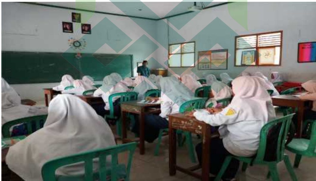
Gb.6: Pembelajaran bahasa Arab di kelas VIII MTs Salafiyah Wonoyoso Buaran Pekalongan.