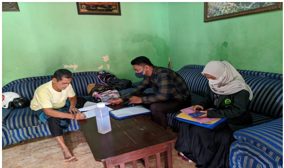
Gambar 1.3 Wawancara dengan pihak Anggota BMT Bahtera Pekalongan