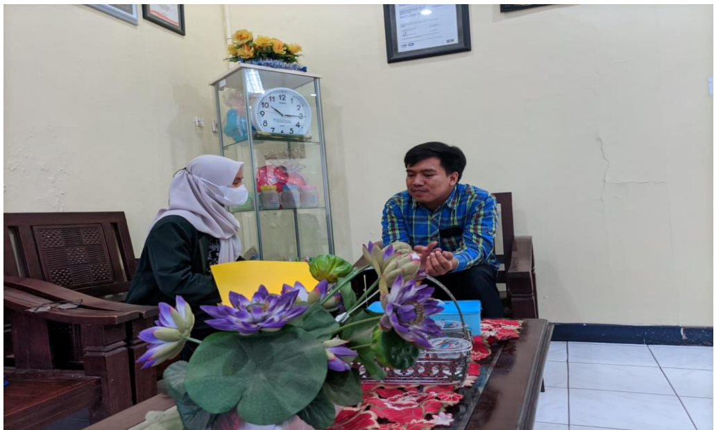
Gambar 1.2 Wawancara dengan pihak BMT Bahtera Pekalongan