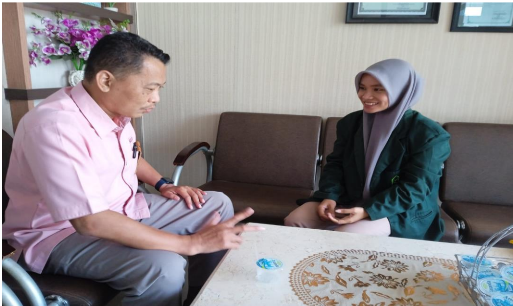
Gambar 1.1 Wawancara dengan pihak BMT Bahtera Pekalongan