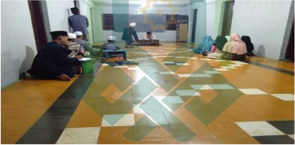
عملية تعليم النحوي الفصل الأول بمعهد روضة العقول