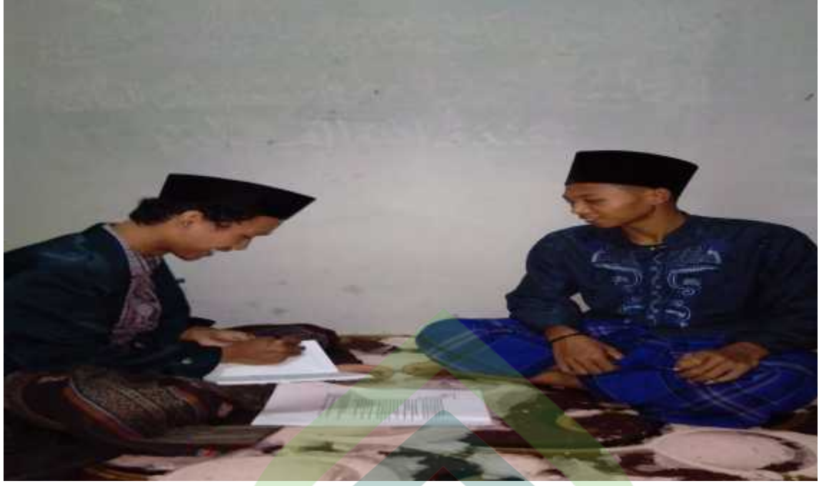
مقابلة مع أستاذ تعليم النحو بكتاب مختصر جدا في المعهد روضة العقول