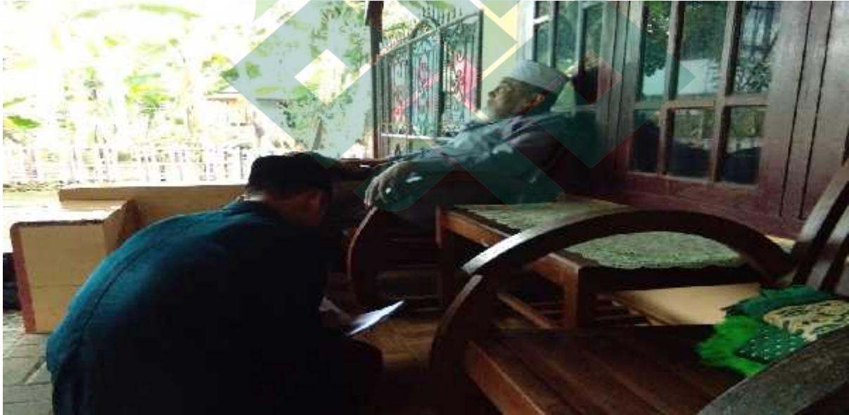
المقابلة مع مدير المعهد روضة العقول