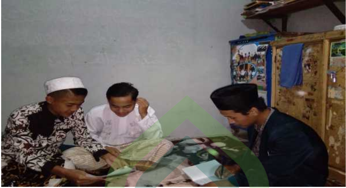
المقابلة مع طلاب الفصل الأول في معهد روضة العقول