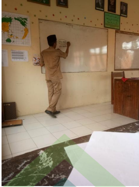
Guru menerangkan tentang fiil madhi dan mudhori' ditengah-tengah pembelajaran