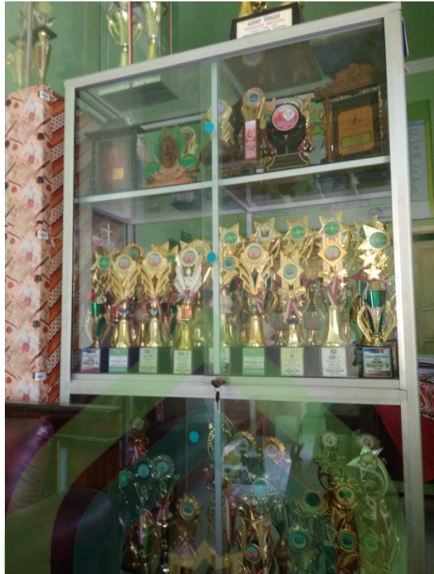
Thropy hasil prestasi siswa-siswi MTs NU Tirto Kabupaten Pekalongan