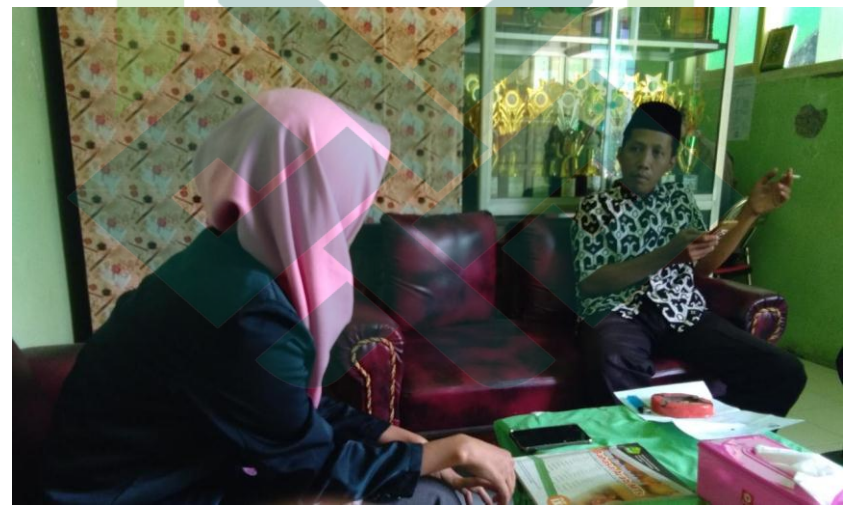
Peneliti melakukan wawancara kepada kepala sekolah sekaligus guru Mata Pelajaran bahasa Arab