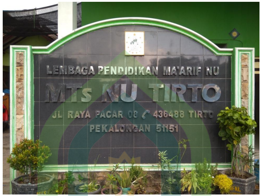
Icon MTS NU Tirto Kabupaten Pekalongan