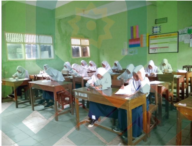
Siswa menulis kalimat-kalimat yang di imla'kan oleh guru