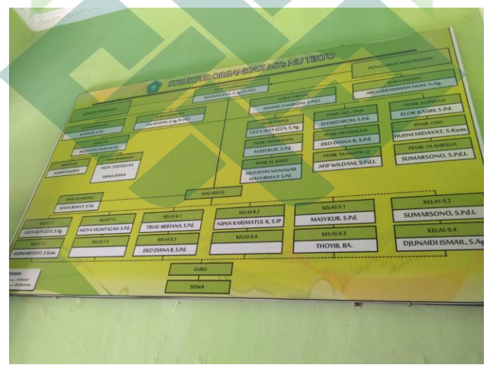
Struktur Organisasi MTS NU Tirto Kabupaten pekalongan