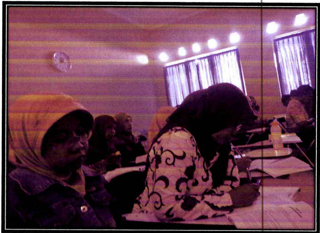
Kondisi Mahasiswa Non Reguler yang terlihat ngantuk saat pembelajaran