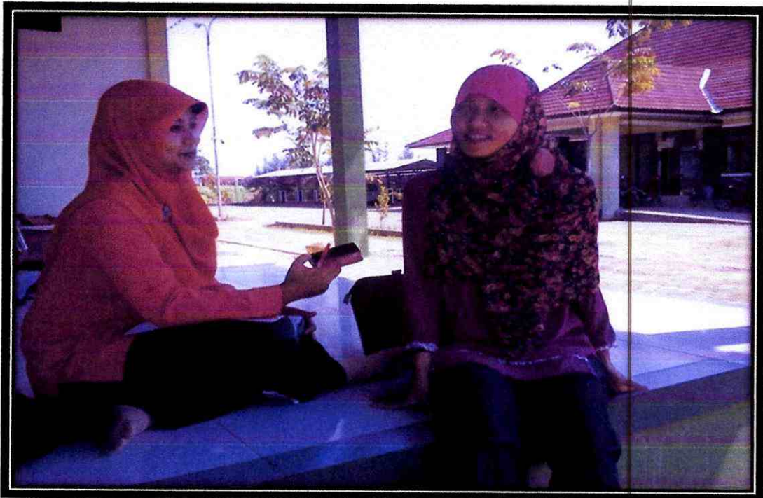
Wawancara Peneliti dengan Mahasiswa Non Reguler