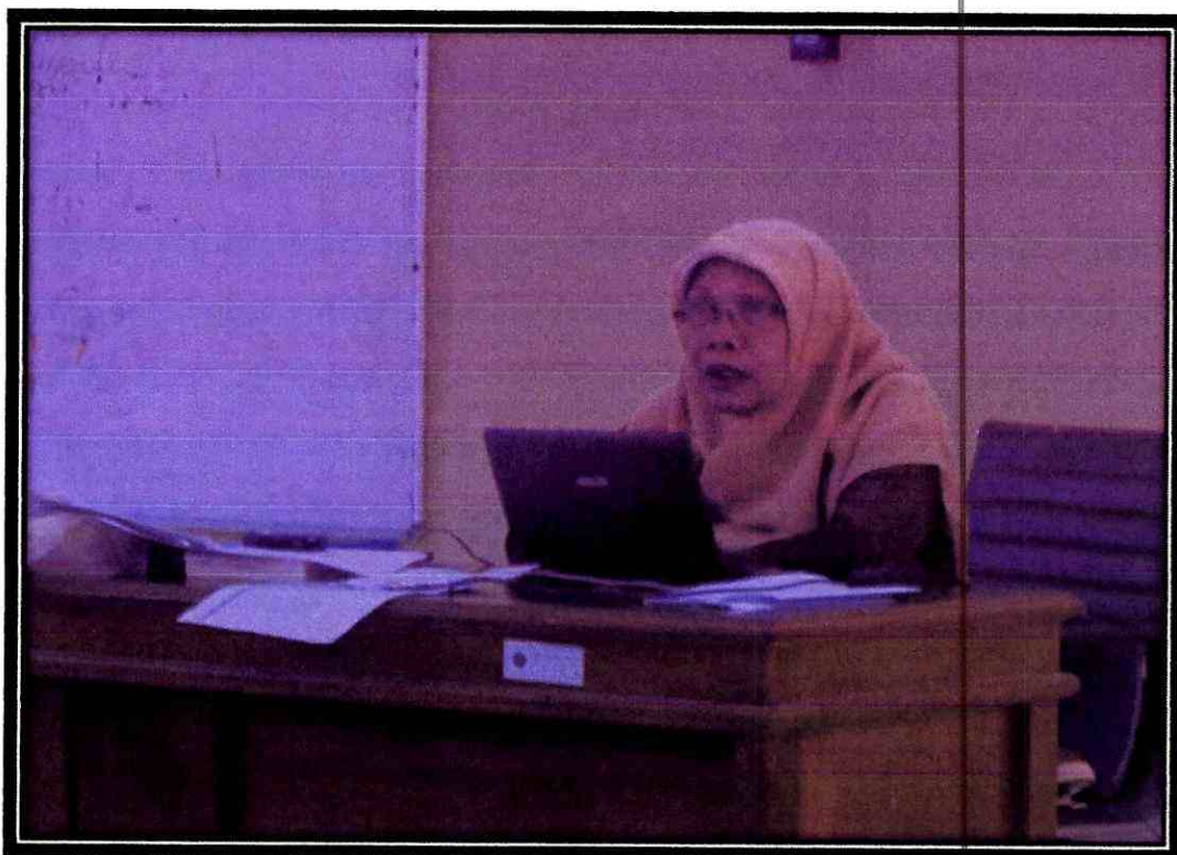
Dosen saat mengajar mahasiswa Non Reguler