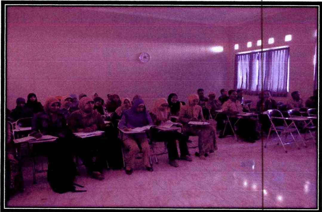
Observasi Partisipatif Peneliti dalam Pembelajaran Mahasiswa Non Reguler