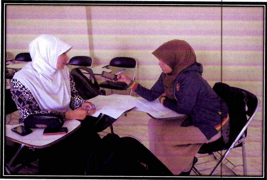
Wawancara Peneliti dengan Mahasiswa Non Reguler