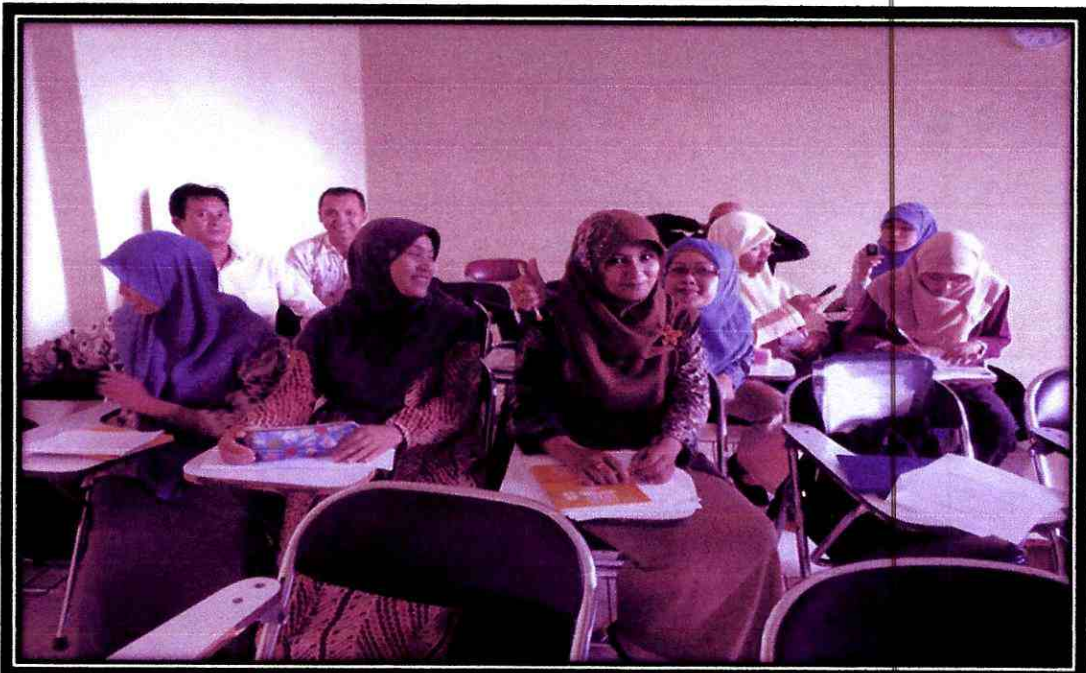
Observasi Partisipatif Peneliti dalam Pembelajaran Mahasiswa Non Reguler