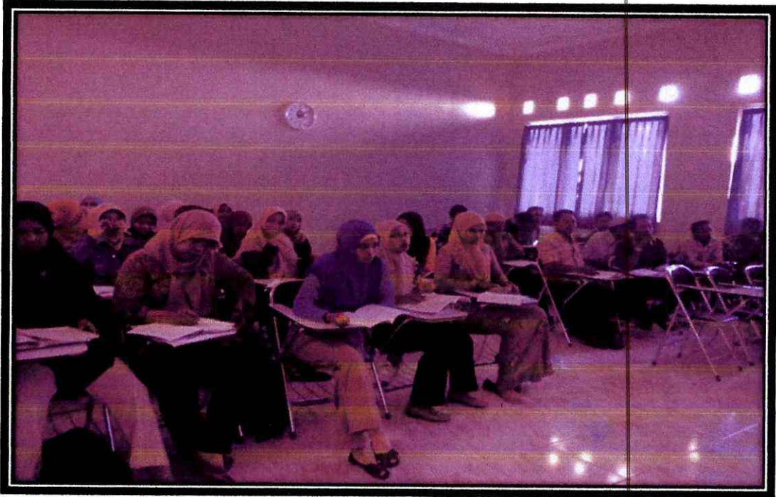
Kondisi Mahasiswa Non Reguler dalam Mengikuti Pembelajaran di Kelas