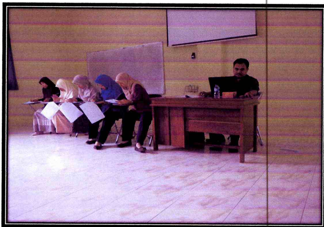
Dosen saat mengajar mahasiswa Non Reguler