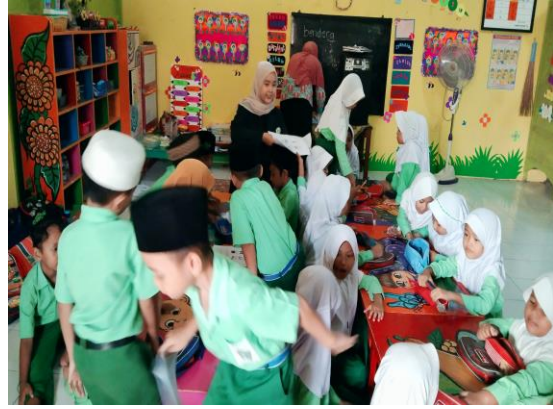
Foto Penyebaran Angket Sikap Sopan Santun