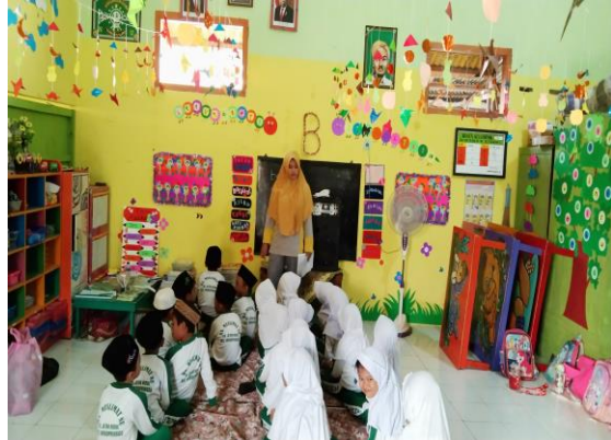
Foto Saat Guru Sedang Memberikan Bimbingan Kepada Anak