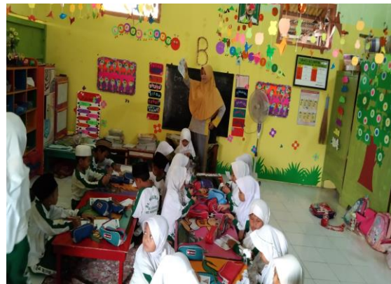
Foto Saat Mengerjakan Pre-Test dan Post-Test