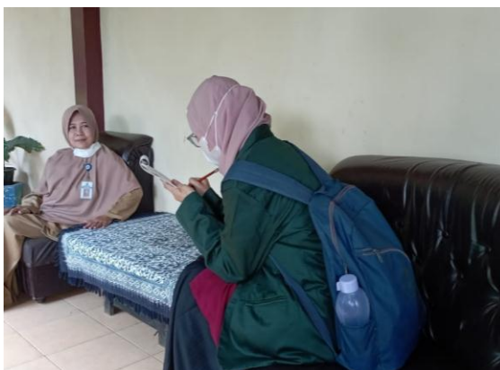
Gambar 1.2 Mengajukan Penyebaran Kuesioner untuk Siswa dan Wawancara