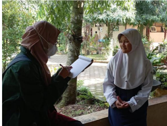
Gambar 1.3 Menjelaskan Tata Cara Pengisian dan Wawancara