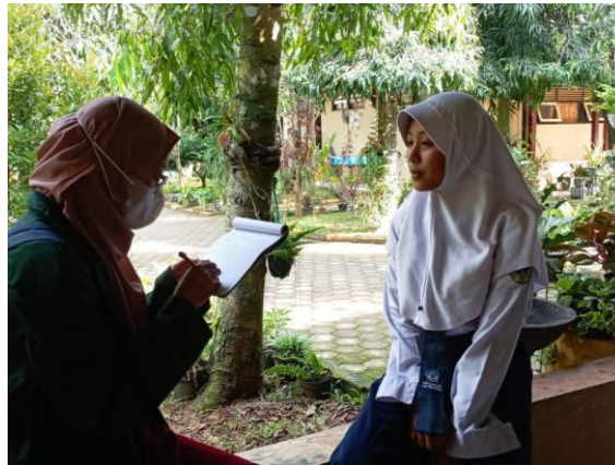
Gambar 1.4 Menjelaskan Maksud dari Setiap Pertanyaan dan Wawancara