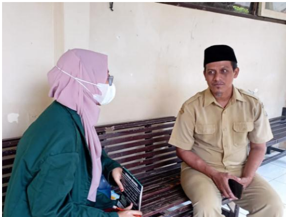
Gambar 1.1 Mengajukan Izin Penelitian dan Wawancara