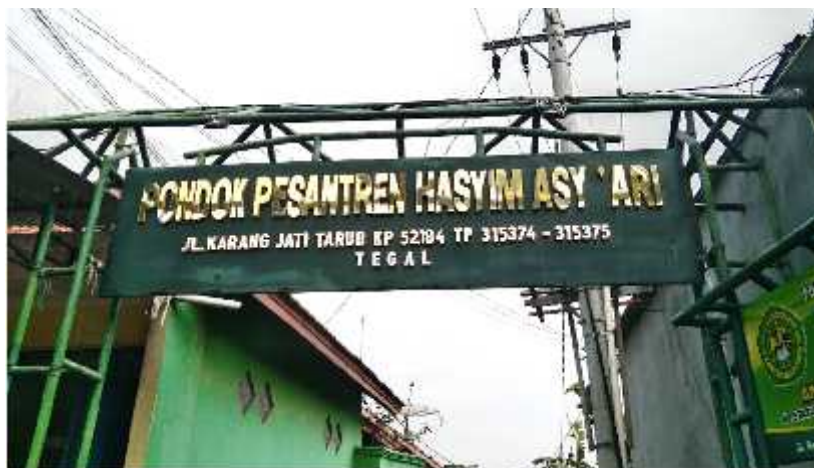
Gedung Ponpes dan Madrasah Hasyim Asy'ari Tarub