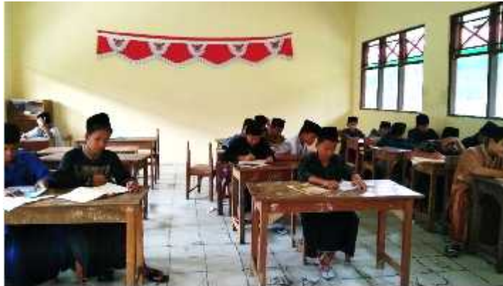
Pembelajaran Fiqih Kitab Safinatun Najah Kelas III D MDTA