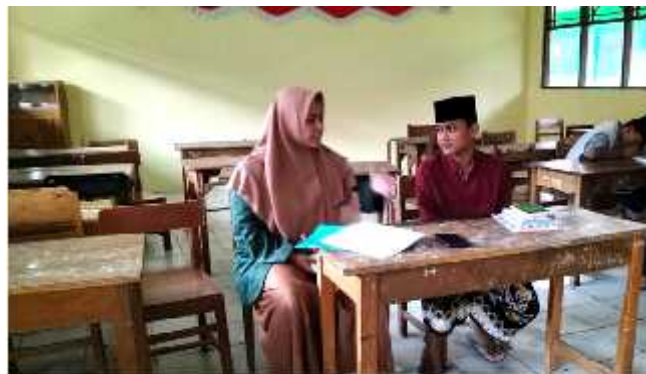
Wawancara dengan santri kelas III D MDTA