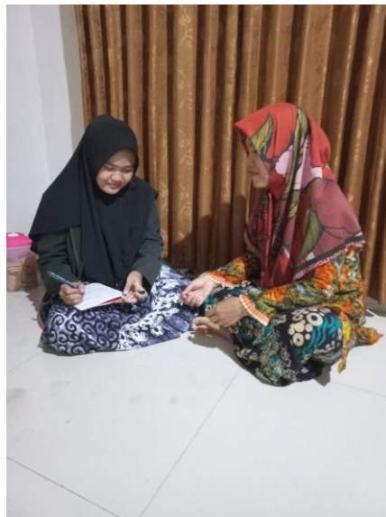
Hasil wawancara dengan pelanggan salon muslimah ziki 25 batang