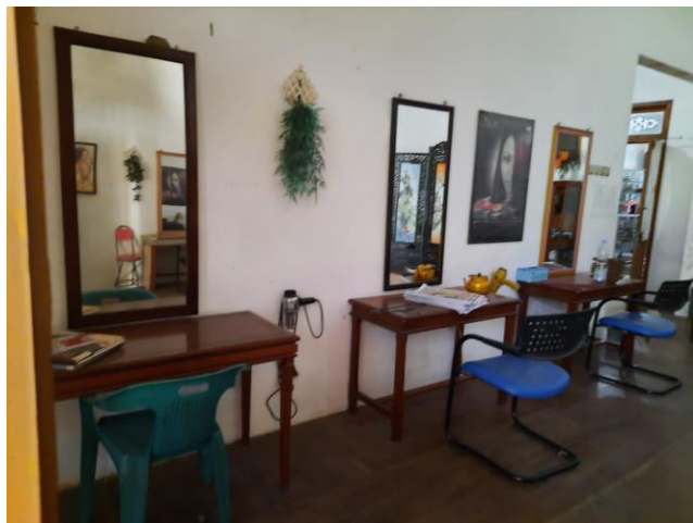
Hasil foto ruangan perawatan rambut salon muslimah “Ziki 25” Batang