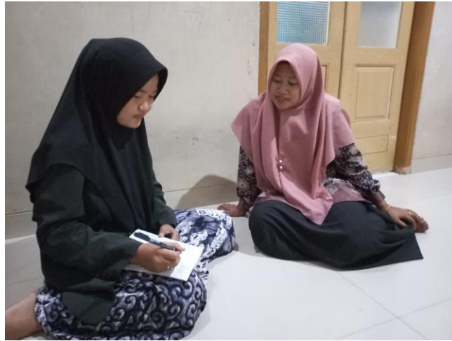
Hasil wawancara dengan pelanggan salon muslimah ziki 25 batang