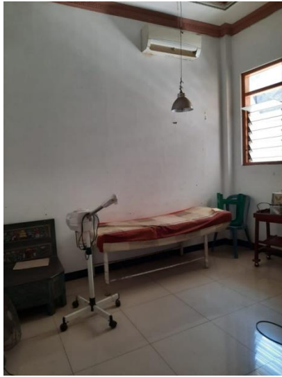
Hasil foto ruangan perawatan salon muslimah “Ziki 25” Batang