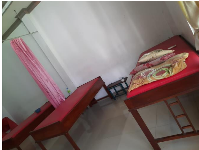
Hasil foto ruangan salon perawatan “Ziki 25” Batang