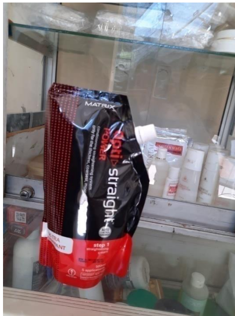
Jenis produk-produk yang digunakan salon muslimah “Ziki 25” Batang