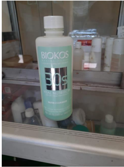
Jenis produk-produk yang digunakan salon muslimah “Ziki 25” Batang