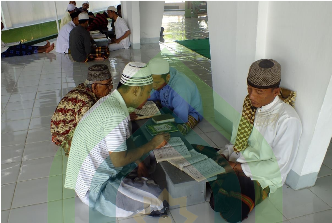
Gb.5. Narapidana Lapas Klas IIA Pekalongan sedang mengikuti Pembelajaran Baca Tulis Al-Qur'an (BTQ).