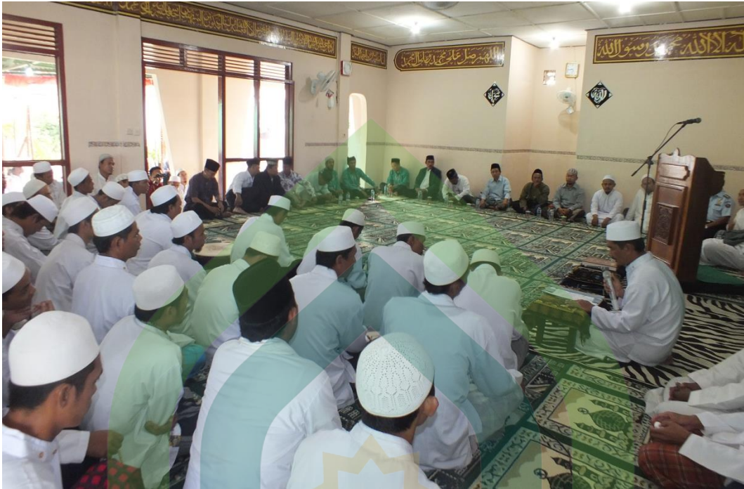
Gb.3. Kegiatan Kajian Agama Islam di Masjid At-Taubah Lepas Pekalongan yang diikuti oleh narapidana.