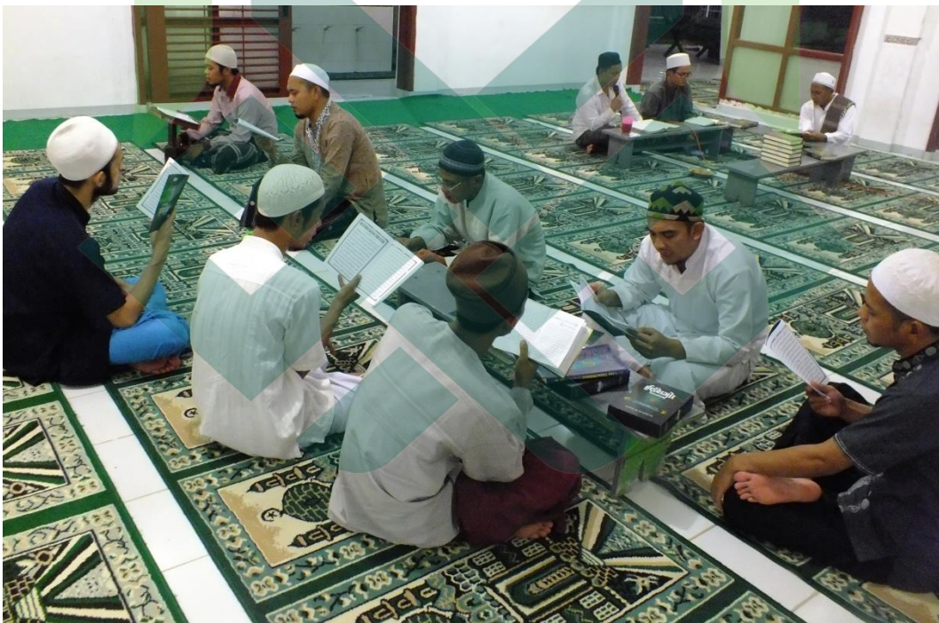
Gb.6. Pada saat bulan Ramadhan, narapidana Lapas Klas IIA Pekalongan juga diberi kesempatan untuk tadarus Al-Qur'an di Masjid At-Taubah Lapas.