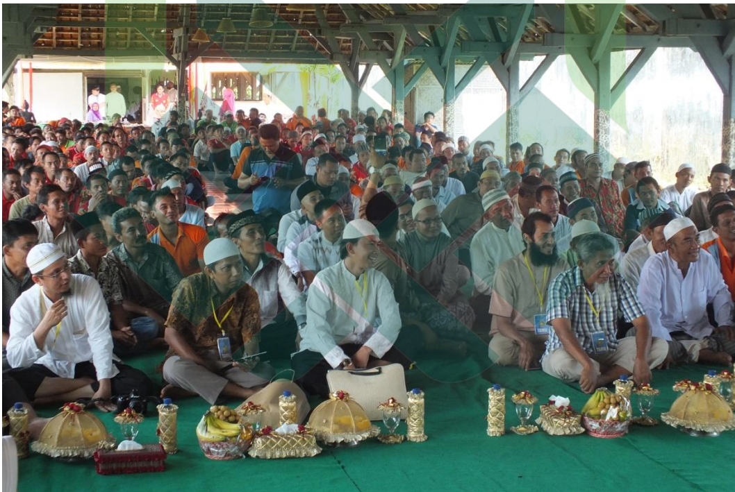
Gb. 10. Yayasan Az-Zubair bin Al-Awwam Kota Pekalongan menyelenggarakan Kajian Islam di Lapas Klas IIA Pekalongan.