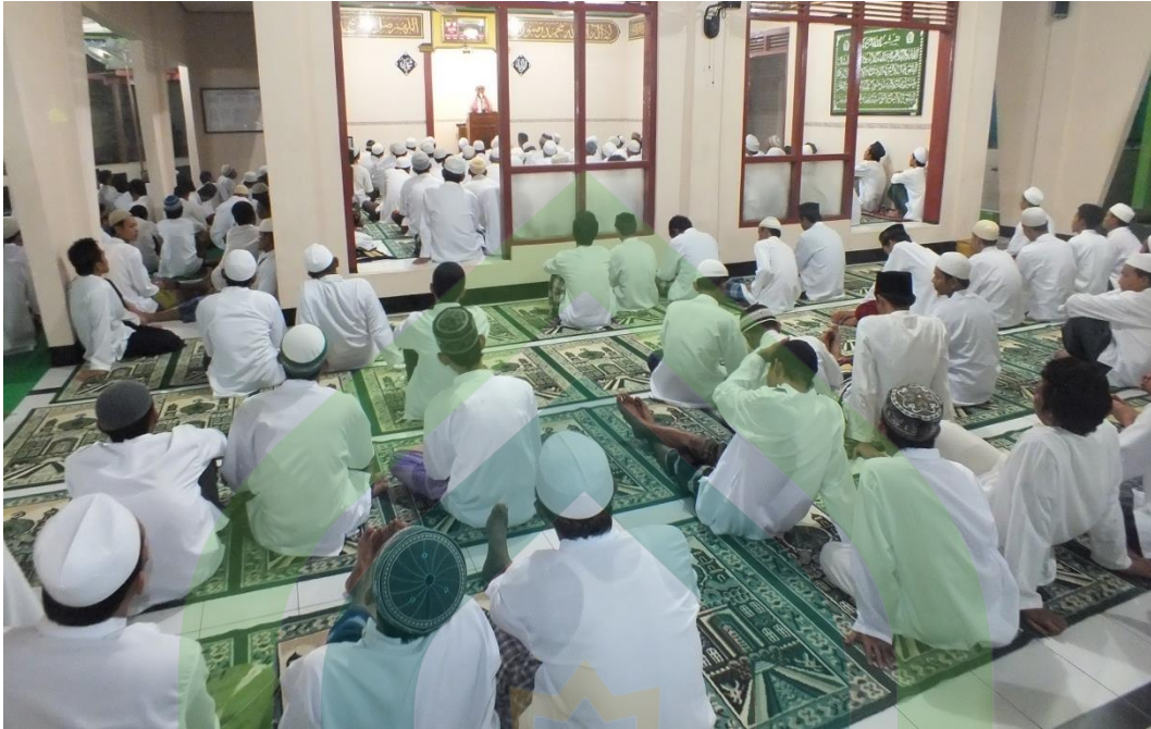
Gb.11. Suasana shalat Tharawih di Masjid At-Taubah Lapas Klas IIA Pekalongan yang diikuti oleh seluruh narapidana dan petugas Lapas.