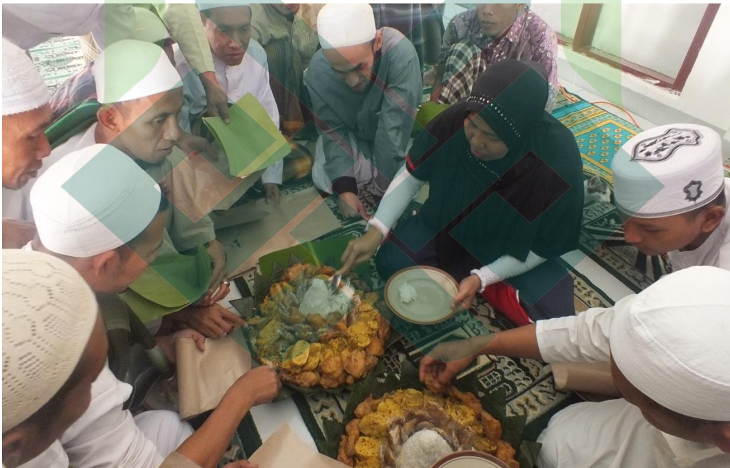
Gb. 8. Guna menarik minat narapidana untuk mengikuti Program Ponpes, pihak Lapas Pekalongan sesekali mengadakan makan bersama di masjid.