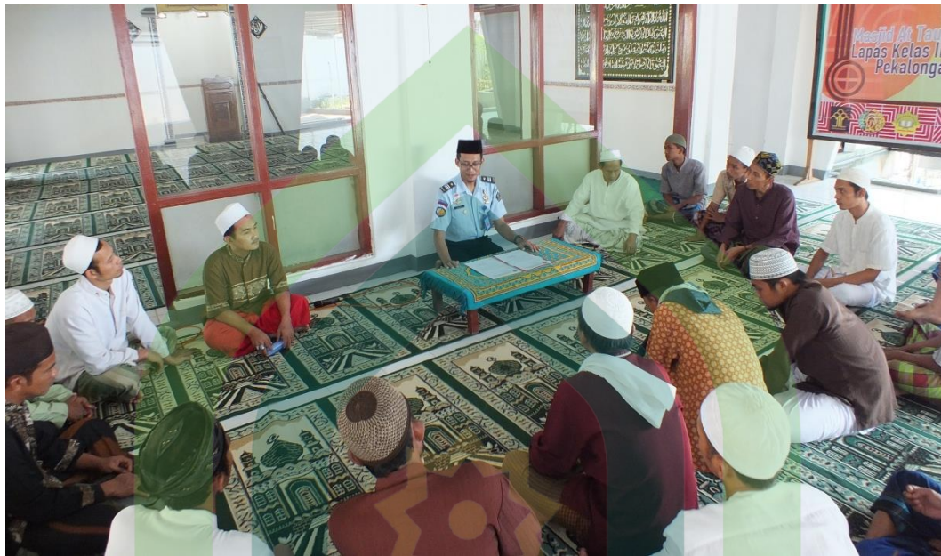
Gb.1. Penulis berdialog dengan narapidana yang mengikuti Program Pondok Pesantren di Lapas Klas IIA Pekalongan