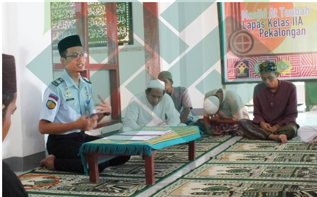
Gb.2. Dialog dengan narapidana ini terkait pelaksanaan program Pondok Pesantren di Lapas Klas IIA Pekalongan.