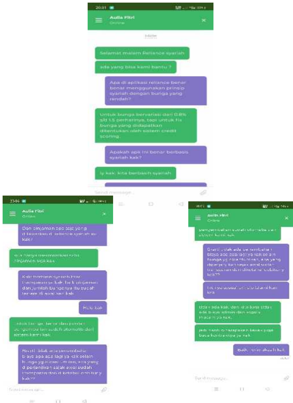
Gambar 1.2 Wawancara pengguna dan admin 1