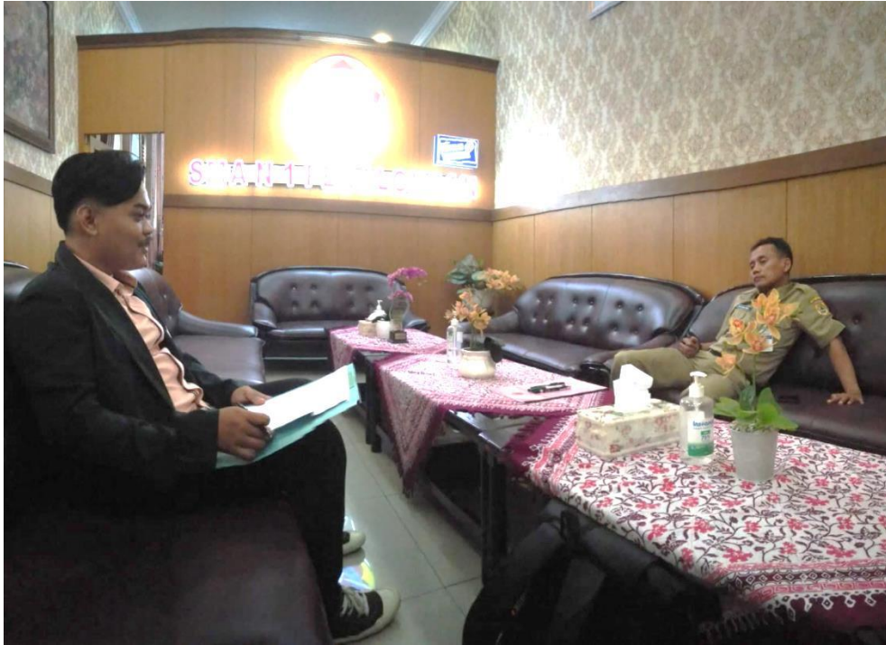
Wawancara dengan Kepala SMA Negeri 1 Kota Pekalongan