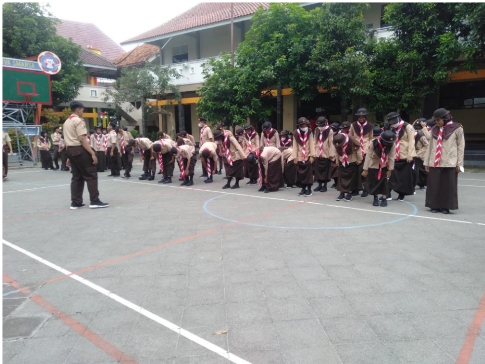
Pemeriksaan peraturan seragam