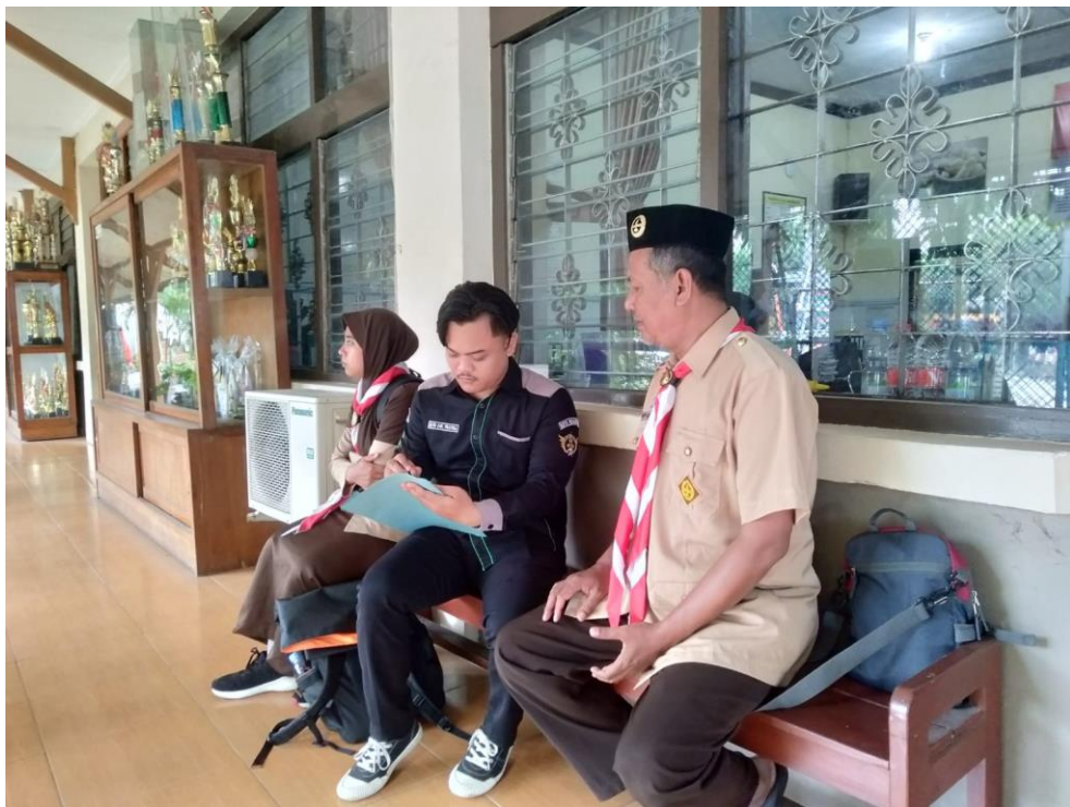
Wawancara dengan Pembina Pramuka