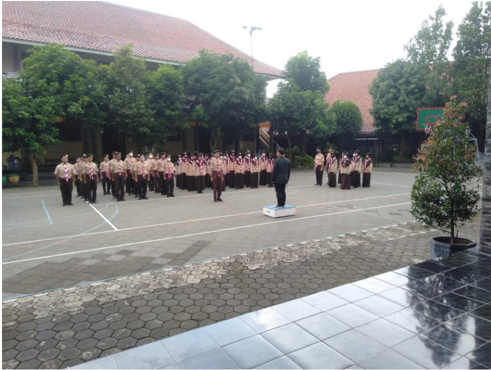
Upacara pembukaan latihan rutin