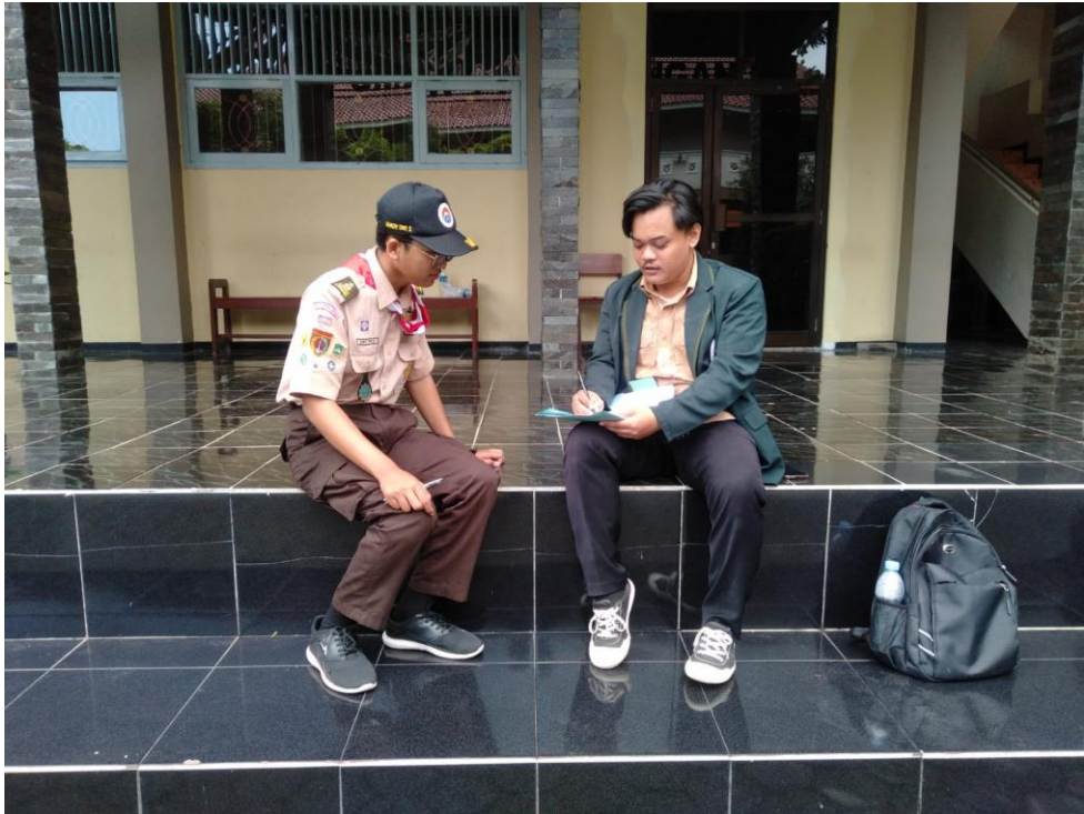
Wawancara dengan peserta didik