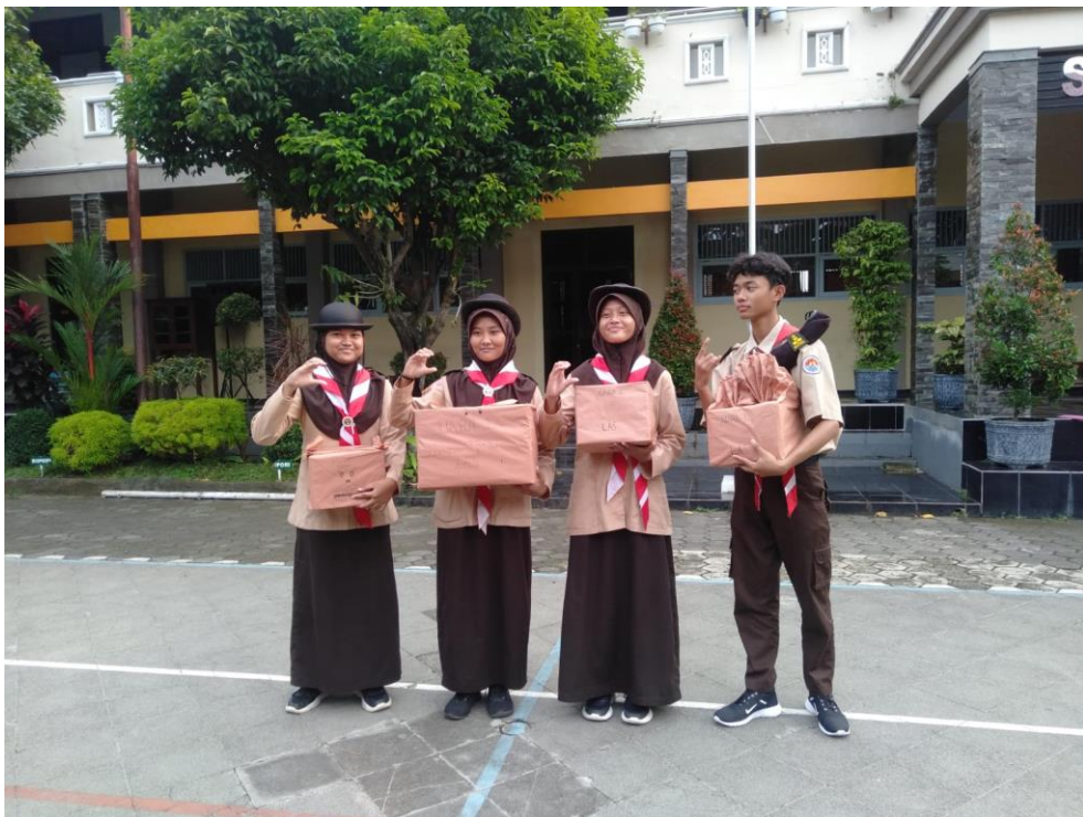
Pemberian hadiah bagi anggota berprestasi di kegiatan