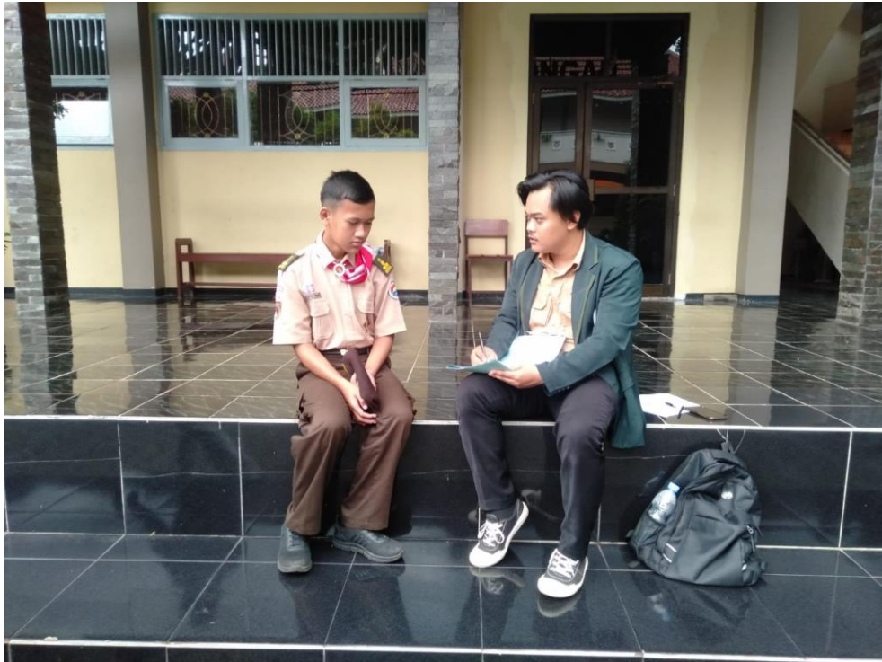
Wawancara dengan peserta didik