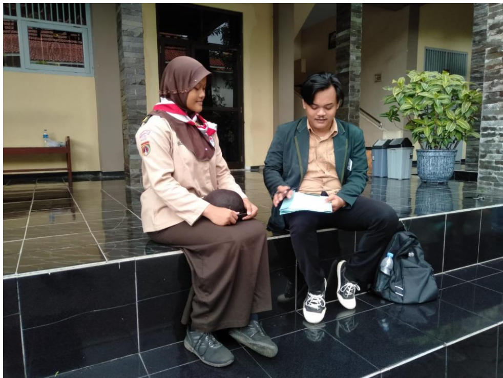
Wawancara dengan peserta didik