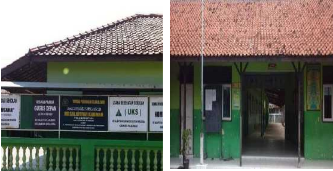
Dokumentasi pelaksanaan AKMI di MI Salafiyah Kauman Wiradesa