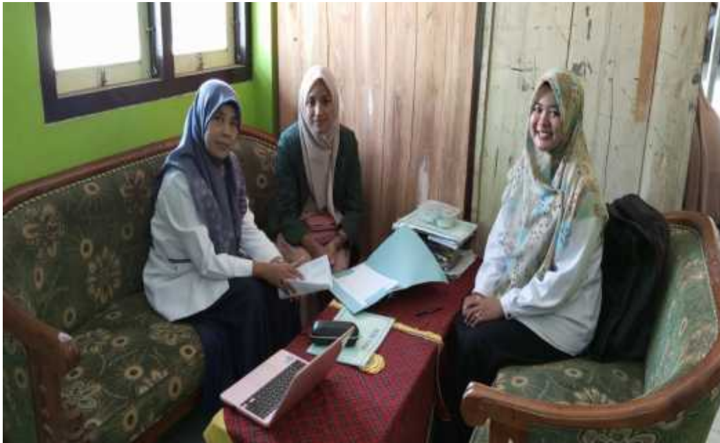
Kegiatan Pengisian Angket Oleh Responden