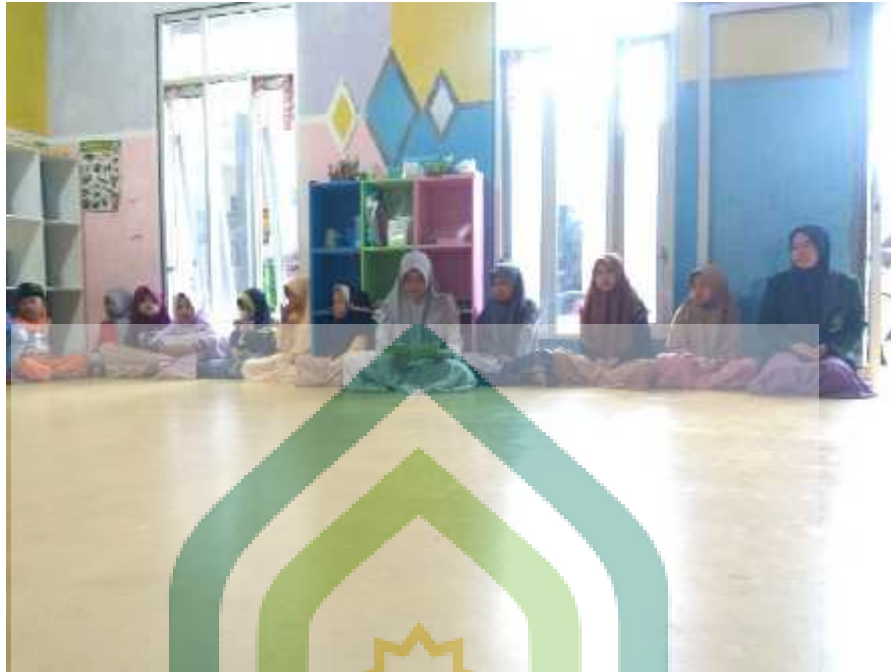
Gambar 1 Ruang Kelas A