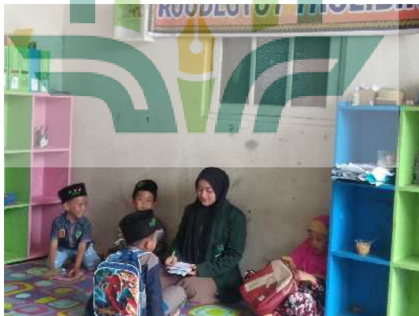
Gambar 2 Ruang Kelas B