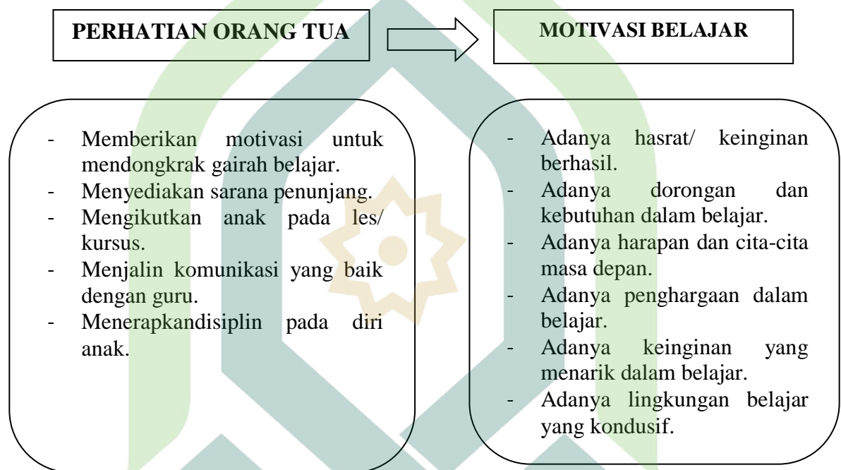
Gambar 1. Bagan Kerangka Teori Hubungan Perhatian Orang Tua Dengan Motivasi Belajar Siswa Kelas VIII Di SMP Negeri 6 Batang

Hipotesis adalah dugaan sementara yang mempunyai dua kemungkinan, yaitu benar atau salah. Dengan kata lain, hipotesis merupakan prediksi terhadap hasil penelitian yang diusulkan. 14 Hipotesis suatu penelitian dapat pula diartikan sebagai sebuah dugaan yang mungkin benar atau salah dan akan diterima jika fakta-fakta membenarkannya. 15