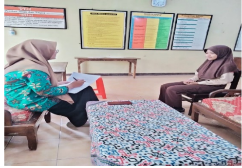
Wawancara Siswa Kelas V