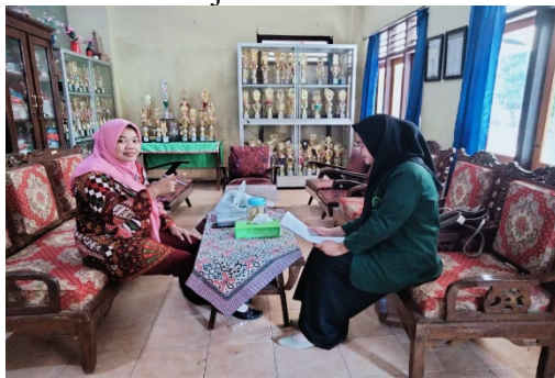
Wawancara Guru Kelas V