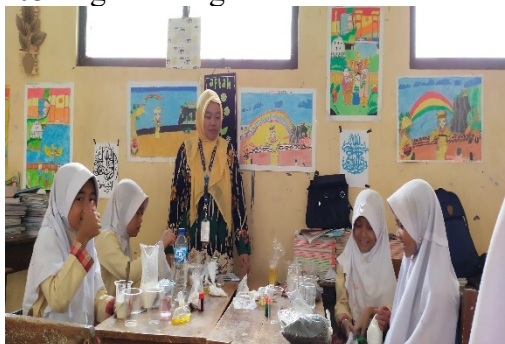
Foto Kegiatan Pelaksanaan Pembelajaran