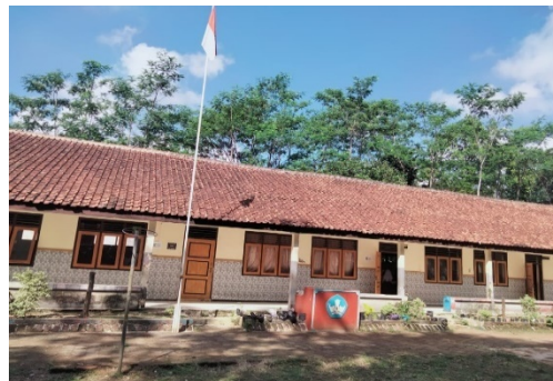
Foto Gedung SD N 03 Legokkalong