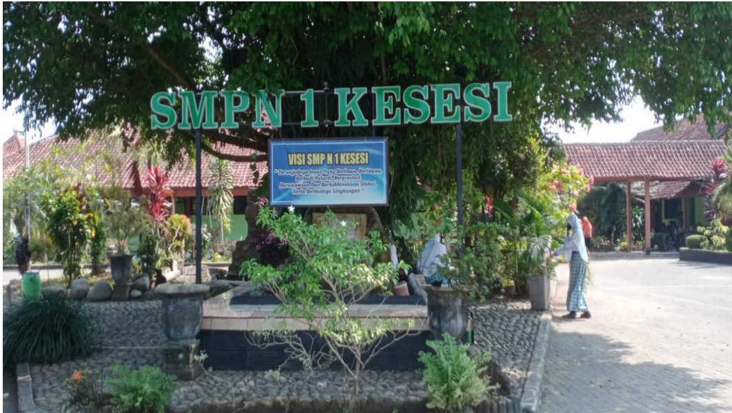
Kedaaan SMP N 1 Kesesi