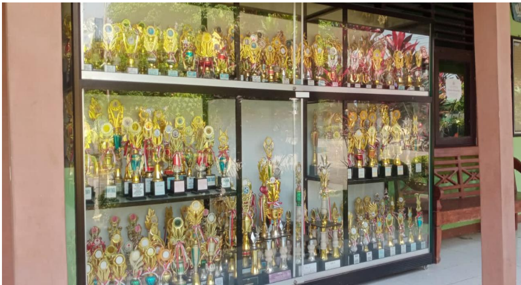
Prestasi Peserta Didik SMP N 1 Kesesi