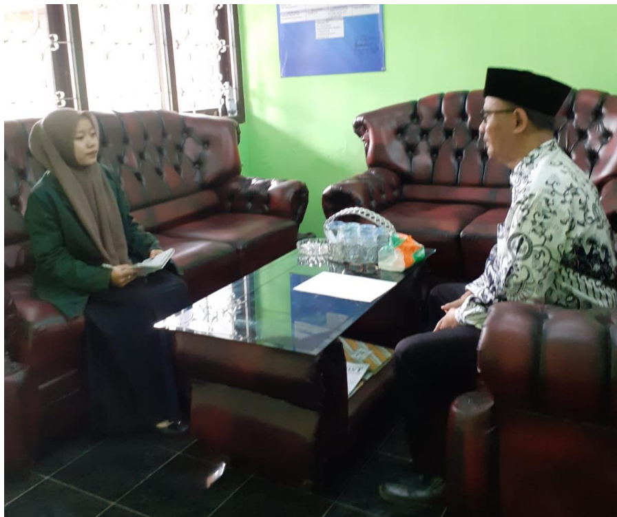
Wawancara dengan Kepala SMP N 1 Kesesi