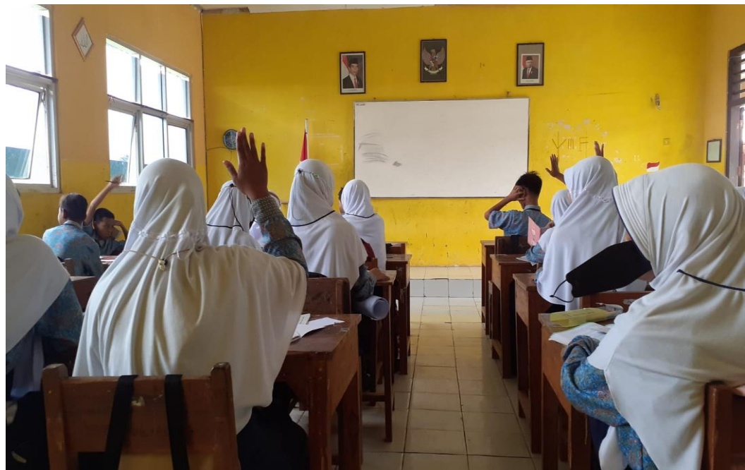
Kegiatan Pembelajaran PAIBP dengan Model Snowball Throwing