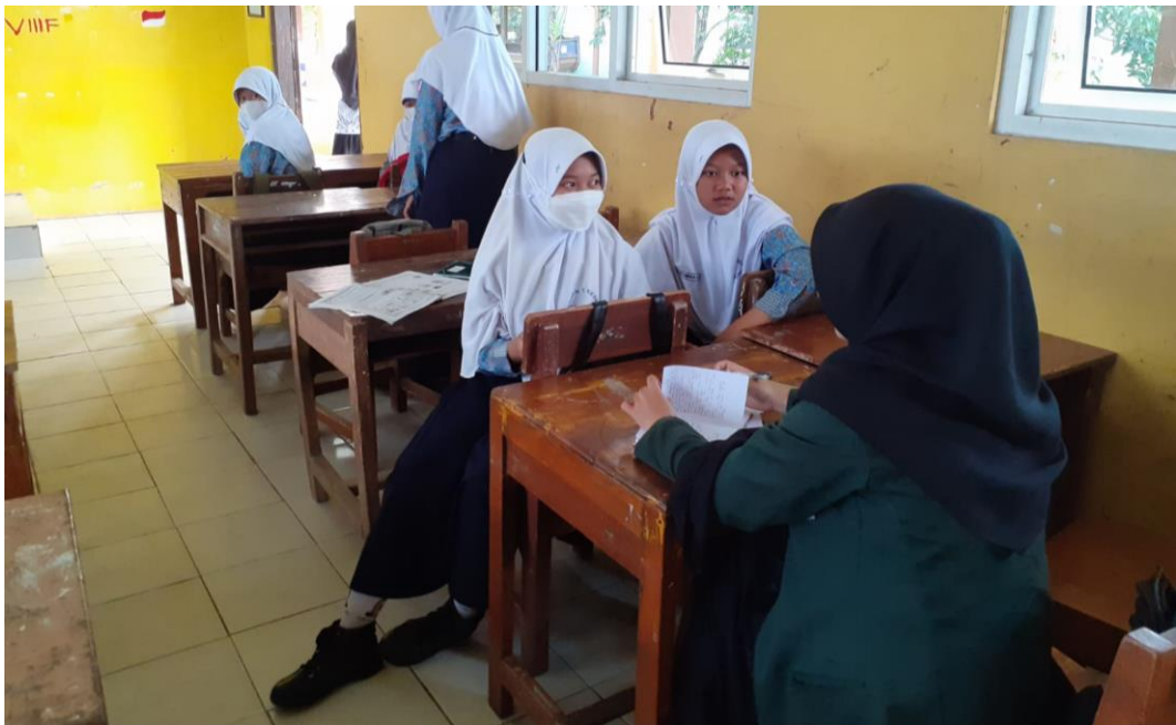
Wawancara dengan Peserta Didik Kelas VIII SMP N 1 Kesesi