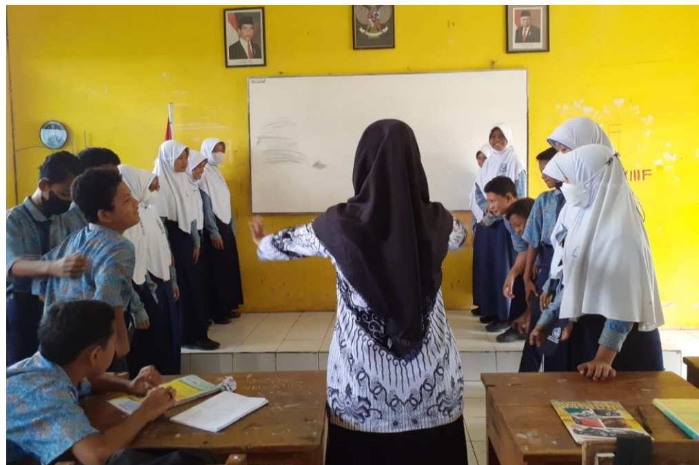
Kegiatan Pembelajaran PAIBP dengan Model Snowball Throwing