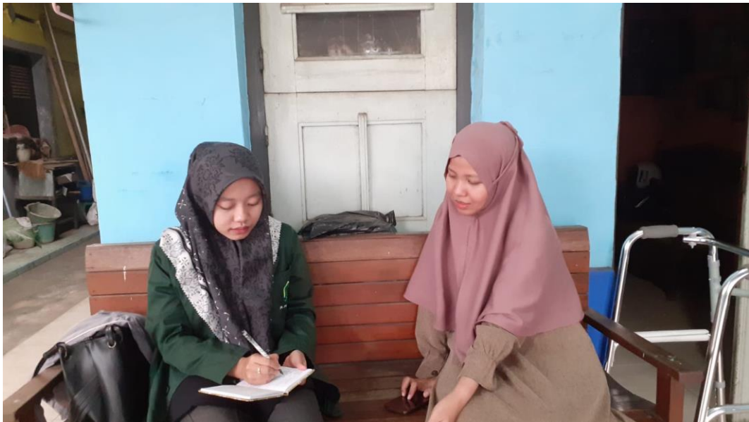
Wawancara dengan Guru PAIBP Kelas VIII SMP N 1 Kesesi