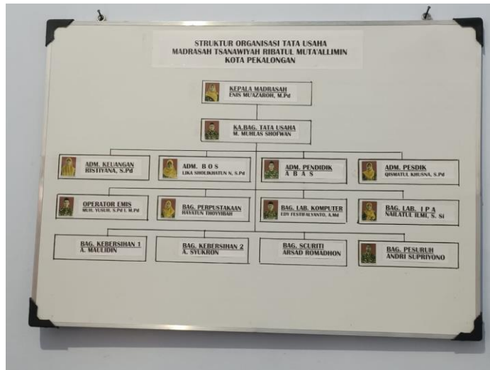
Dokumentasi Struktur Organisasi Tata Usaha MTs Ribatul Muta'allimin