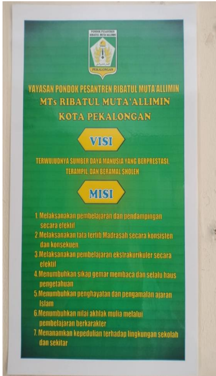
Dokumentasi Visi dan Misi MTs Ribatul Muta'allimin