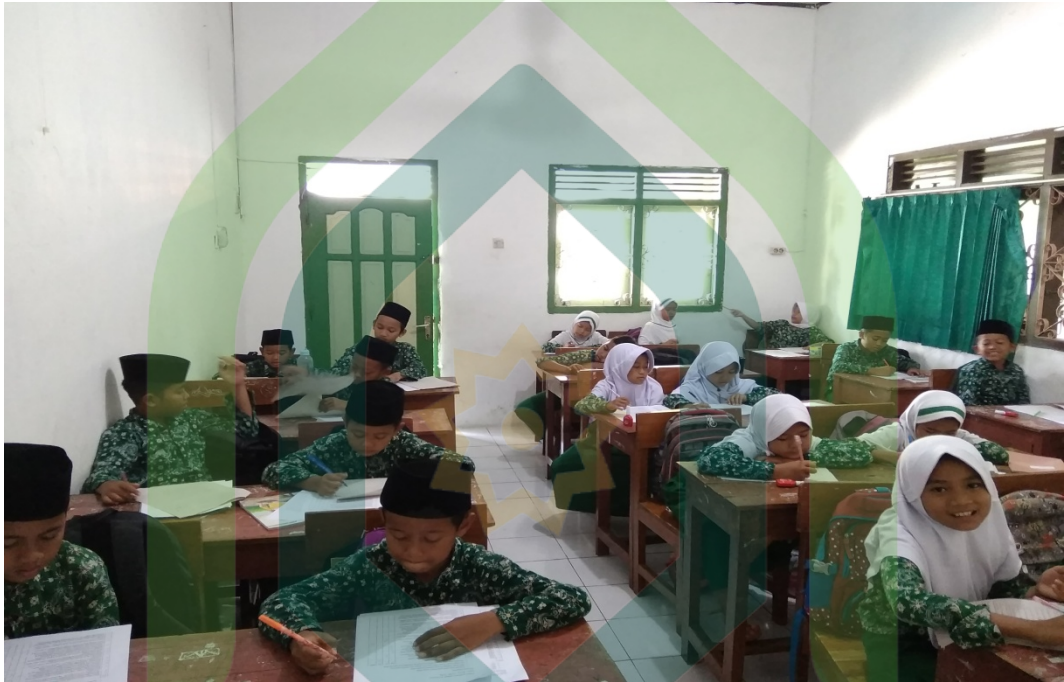
Ruang Kelas 5