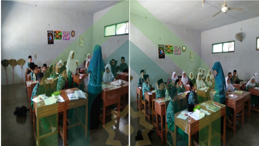
Gambar 5 & 6