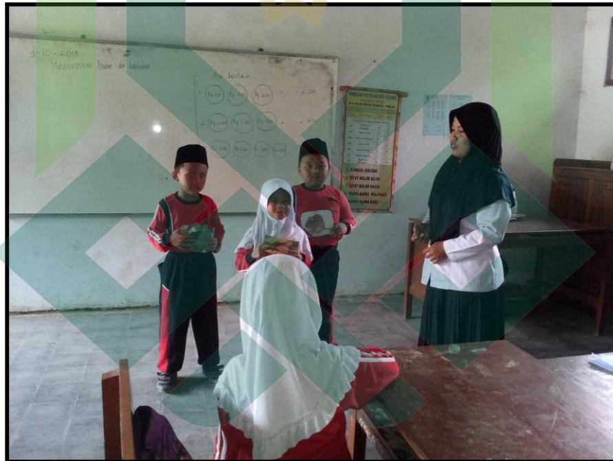
Siswa Maju ke Depan Kelas Mempresentasikan Hasil Diskusi Siklus II