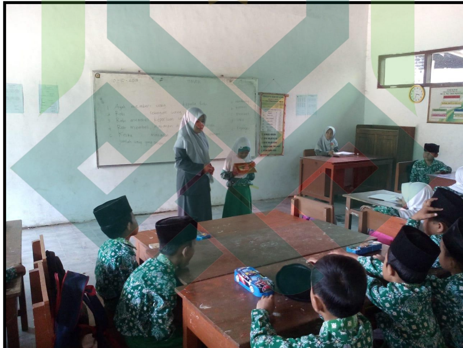
Siswa Maju ke Depan Kelas untuk Mempresentasikan Hasil Diskusi Siklus I