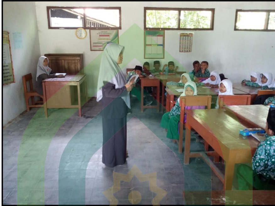
Guru Menyampaikan Materi Siklus I