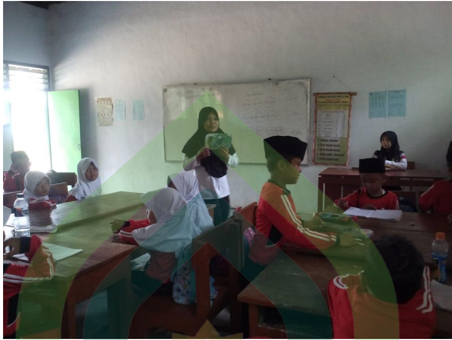
Guru Membagi Siswa dalam beberapa kelompok Siklus II