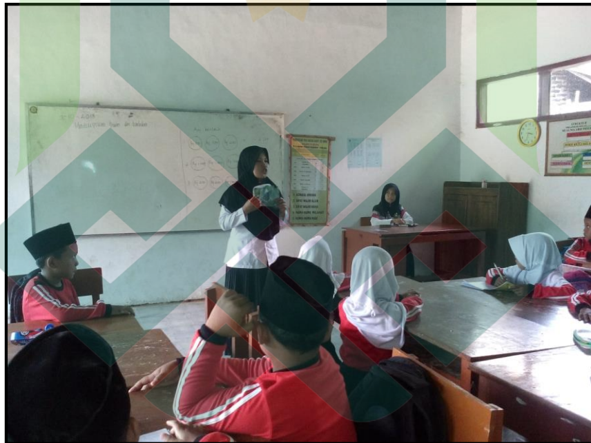
Guru Memberikan Petunjuk Siklus II