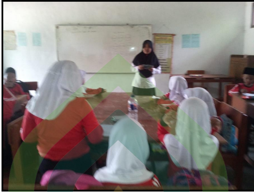
Guru Menyampaikan Materi Siklus II