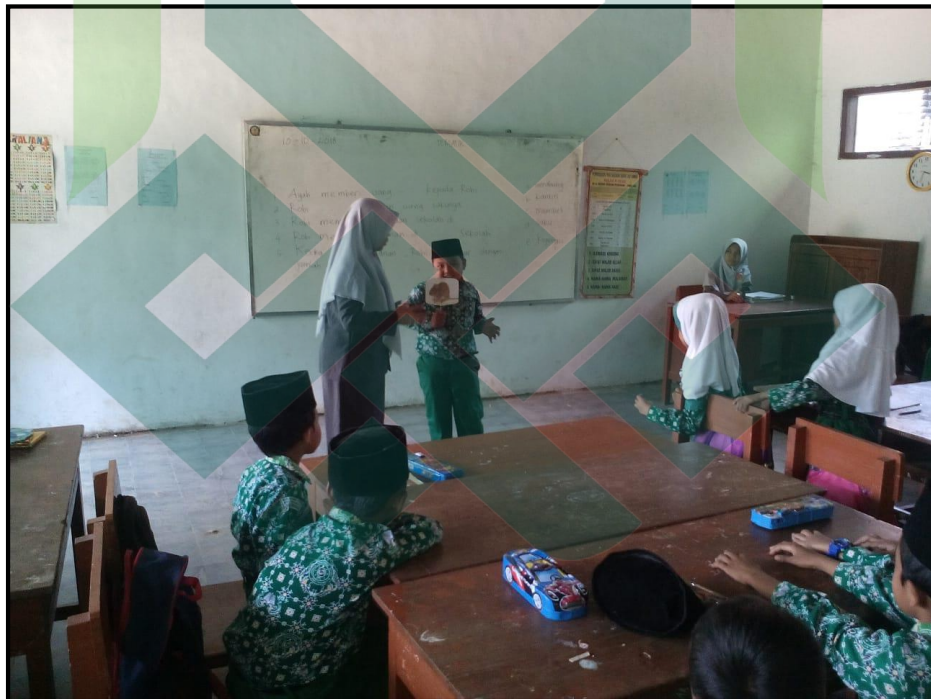
Guru Memberikan Petunjuk kepada Siswa Siklus I