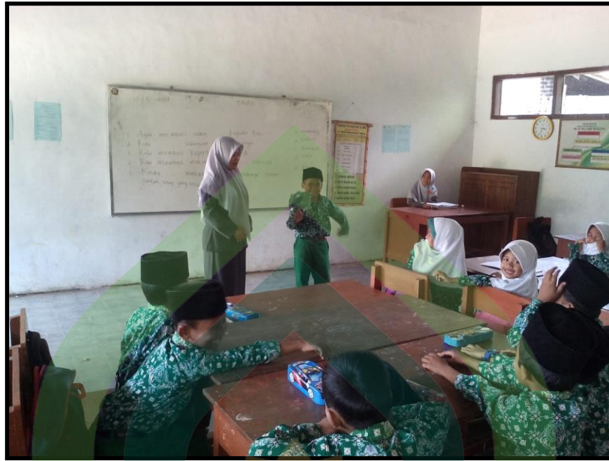
Guru Meminta Salah Satu Siswa Latihan Berbicara di Depan kelas Siklus I