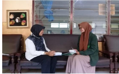
Sebelah Kanan Wawancara dengan Ibu Kepala Sekolah dan sebelah kiri dengan Ibu Bahriyah guru PAI SMP Negeri 1 Tegal