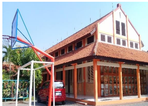
Fasilitas Perpustakaan dan Lingkungan yang Nyaman untuk Membaca