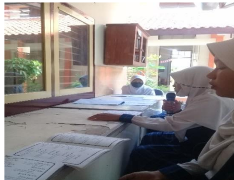
Kegiatan IMTAK (Iman dan Takwa) SMP Negeri 1 Tegal