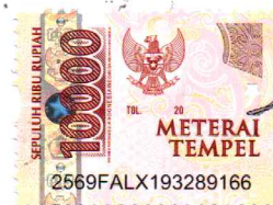
NUR KHALIMATUS SA'DIYAH

NB : Harap diisi, ditempel meterai dan ditandatangani Kemudian diformat pdf dan dimasukkan dalam file softcopy /CD