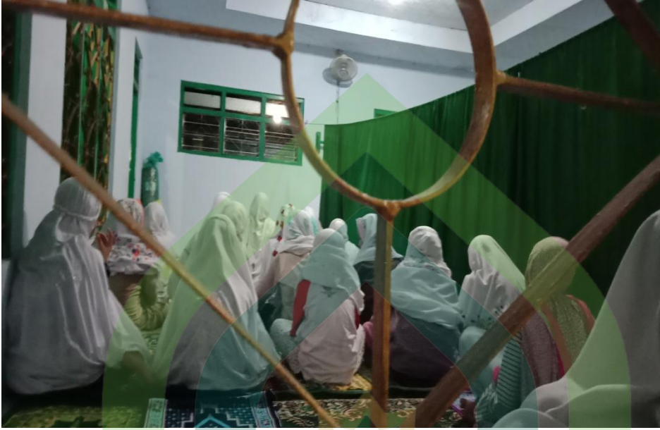
h. Kegiatan ngaji bandongan