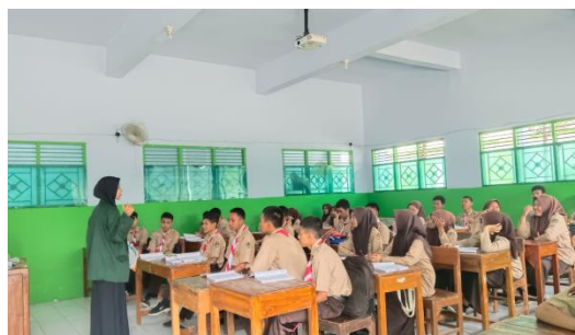
Proses Pembelajaran Kelas Eksperimen ( Learning Start With A Question )