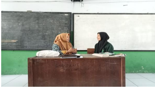
(Wawancara Guru PAI)