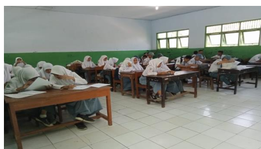
(Pretest Kelas Kontrol dan Eksperimen)