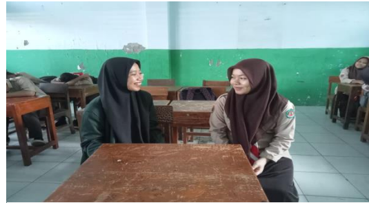
(Wawancara Peserta Didik Kelas X TKJ)