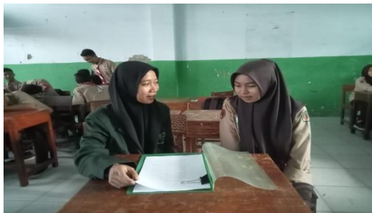
(Wawancara Peserta Didik Kelas X TKJ)