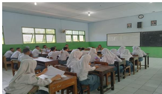
Proses Pembelajaran Kelas Kontrol (Metode Konvensional)