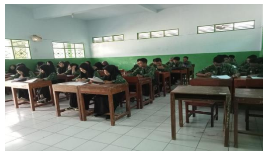
(Peryebaran Soal Uji Coba)