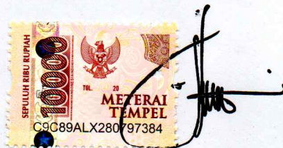
SITI CHUMAEROTUR ROFIATUR RISQOH

NB: Harap diisi, ditempel meterai dan ditandatangani Kemudian diformat pdf dan dimasukkan dalam file softcopy /CD